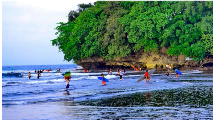
Gambar 1:1 Pantai Batu Karas