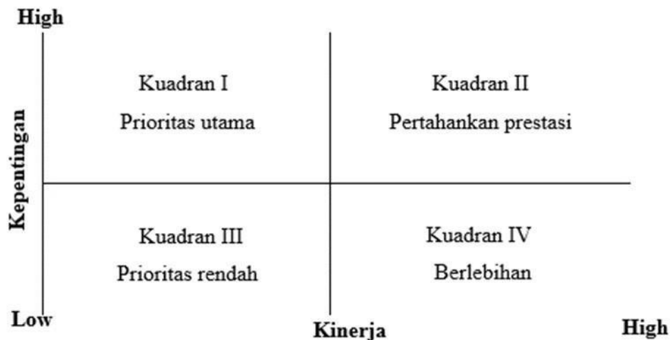
Gambar 2. Importance Performance Analysis

Penjabaran tiap atribut dalam diagram cartesius seperti terlihat pada diagram cartesius Importance Performance Analysis (IPA) sebagaimana diberikan pada gambar 3.2 berikut :