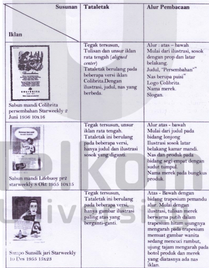
Tabel 1.1 Matriks Kategori Tataletak dan Alur Tersusun

Berikut adalah contoh penggunaan matriks dalam analisis oleh Didit Widiatmoko Suwardikun.