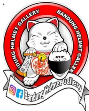
Gambar 1. Logo Bandung Helmet Gallery