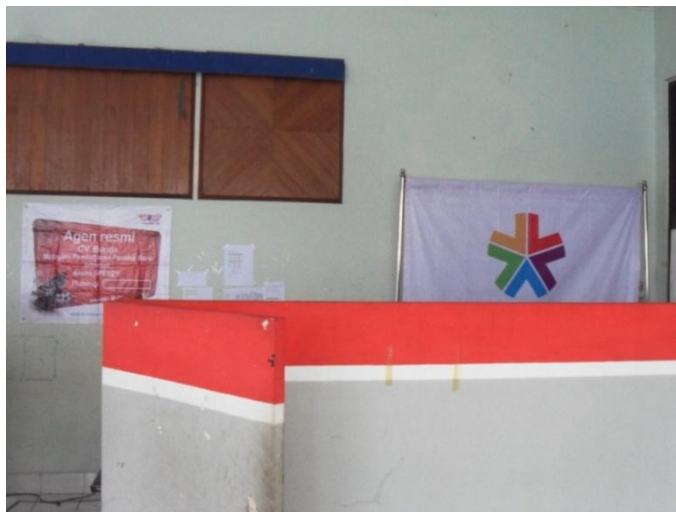
Foto tampak depan Kantor Cabang Utama CV Bunda, Gedung Telkom Jl. Pagongan No. 11