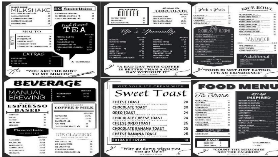
Gambar 1.1 Daftar Menu Up's Cafe