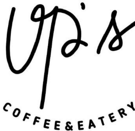
Gambar 1.3 Logo Up's Cafe