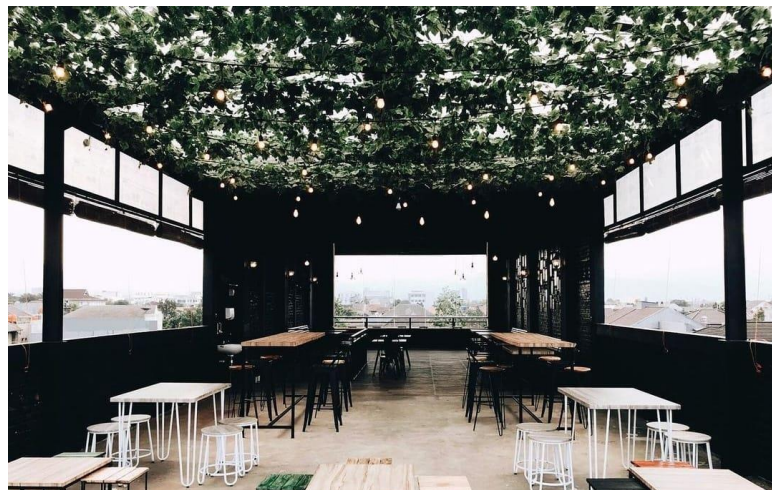
Gambar 1.2 Tampilan Tempat Up's Cafe

Seiring dengan bertambahnya pelanggan maka UP'S mendekorasi tempat menjadi Cafe yang memiliki 4 lantai dengan mengusung tema interior ruangan Cafe industrial. UP'S memakai tema Cafe industrial karena tema ini sangat memberikan kenyamanan untuk pelanggan serta untuk mengusung tema ini tidak membutuhkan biaya yang sangat banyak. Pada lantai 1 dan 2 interior ruangan Cafe terdapat jendela yang besar dan tempat duduk dan meja yang saling berhadapan serta terdapat teras didepannya, lalu pada lantai 3 dan 4 terdapat kursi dan meja yang terbuat dari semen dan interior ruangan Cafenya terbuka