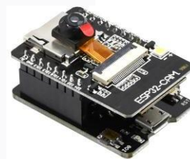
GAMBAR 2 ESP 32 CAM

ESP32-CAM Ini adalah modul yang dapat Anda gunakan dengan banyak proyek, dan dengan Arduino. Merupakan modul lengkap dengan mikrokontroler terintegrasi, yang dapat membuatnya bekerja secara mandiri. Selain konektivitas WiFi + Bluetooth, modul ini juga memiliki kamera video terintegrasi, dan slot microSD untuk penyimpanan. Ukuran huruf untuk isi tabel disesuaikan dengan kebutuhan, dengan memperhatikan keterbacaan.