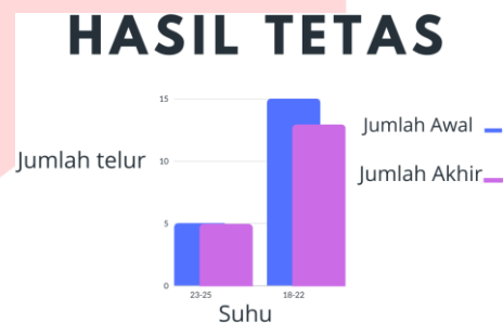
GAMBAR 5 PENGUJIAN

Pada bagian ini yaitu melakukan perbandingan dari dua kali percobaan, ada beberapa yang dapat mempengaruhi proses penetasan yaitu temperatur pada daerah tersebut, dan banyaknya telur yang akan di tetaskan.