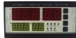
GAMBAR 1 THERMOSTAT XM18 [1]

Sistem kontrol tersebut di setting secara otomatis dengan menggunakan sensor suhu yang akan membaca suhu ruangan dan dipadukan dengan teknologi microcontroller.