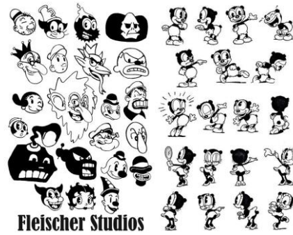
Gambar 1 Konsep Ilustrasi