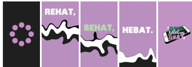
Gambar 9 Klip Video Reels