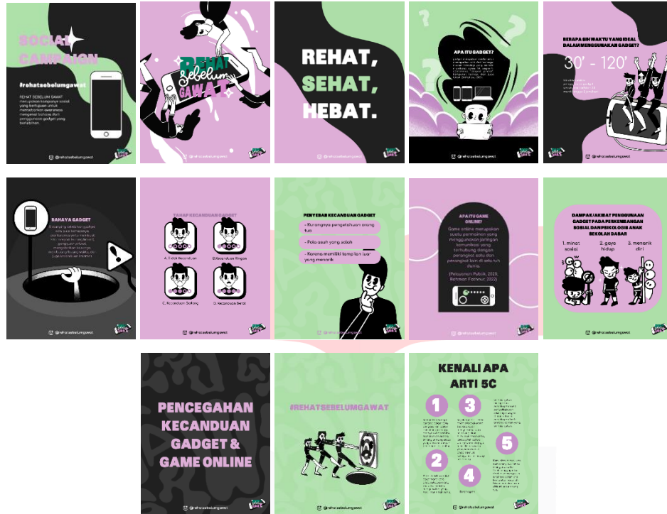
Gambar 7 Poster