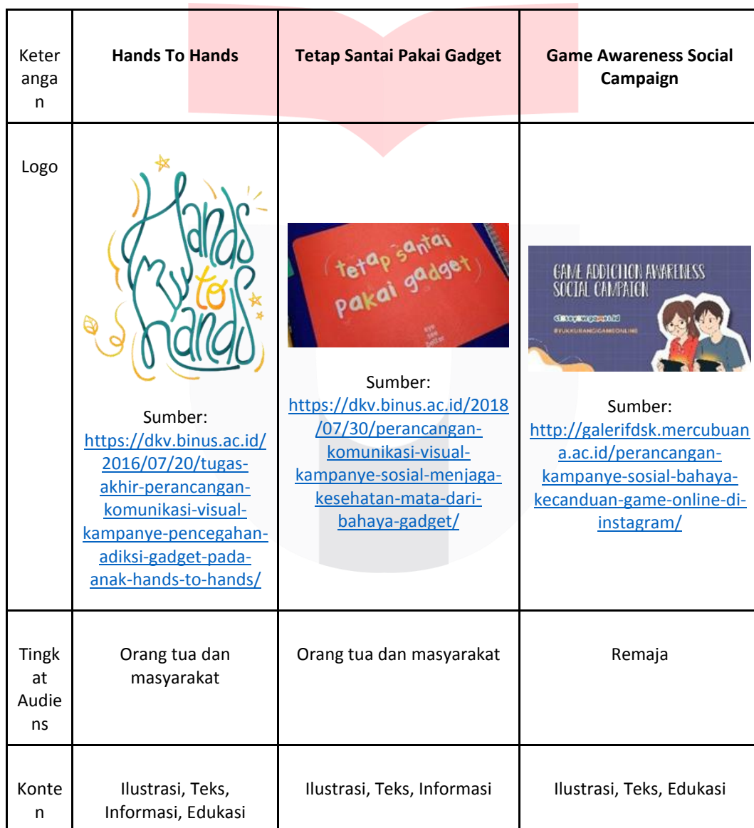
Tabel 1 Matriks Perbandingan Kampanye Sosial