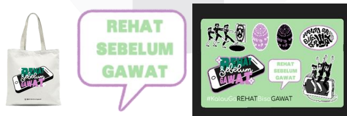
Gambar 8 Merchandise tote bag, pin, sticker