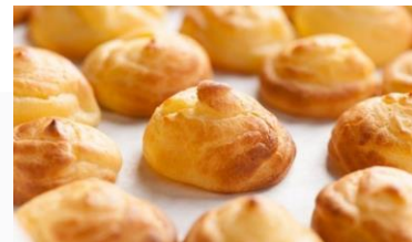
GAMBAR 3 Choux