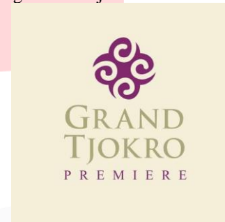
GAMBAR 2 Logo Grand Tjokro Hotel Bandung