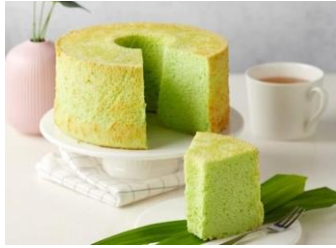
GAMBAR 4 Bolu Pandan