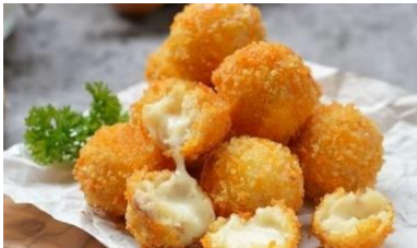
GAMBAR 6 Bitterballen