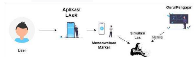
GAMBAR 1. ARSITEKTUR APLIKASI

Aplikasi Augmented Reality berbasis Android yang dirancang diberi nama LAsR. seperti yang terlihat pada gambar 3.1 aplikasi LAsR memiliki 2 fitur utama yaitu saat melakukan simulasi las akan terlihat jarak dan sudut kemiringan antara elektroda dan benda kerja. kemudian Guru/Pengajar akan menilai apakah jarak dan sudut kemiringan antara elektroda dan benda kerja itu sudah tepat atau tidak.