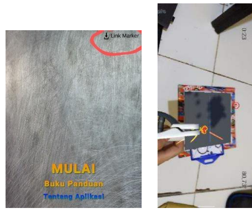
GAMBAR 3. APLIKASI HASIL IMPLEMENTASI

Berdasarkan kebutuhan pengguna yang telah dianalisis, fitur-fitur dalam aplikasi dapat disajikan dalam use case diagram seperti tampak pada Gambar 3.2. Terdapat dua orang aktor, yaitu siswa sebagai user dan guru/pengajar sebagai penilai. penilai hanya dapat melakukan penilaian terhadap user yang melakukan pengelasan dengan melihat jarak dan sudut kemiringan antara elektroda dengan benda kerja.