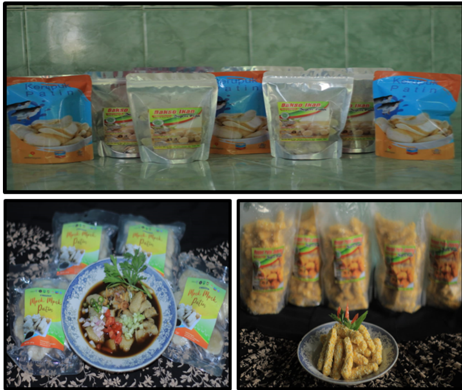
Gambar 1.4. Produk Kuliner Kampung Patin