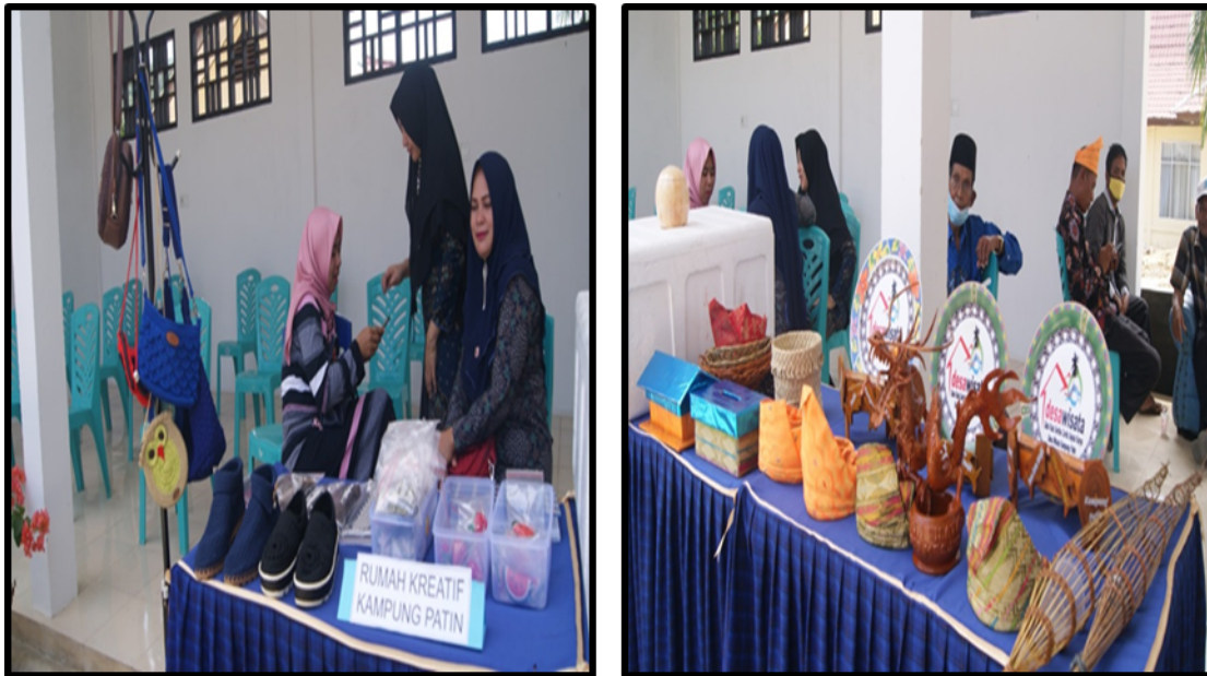
Gambar 1.5. Produk Kerajinan Tangan Kampung Patin