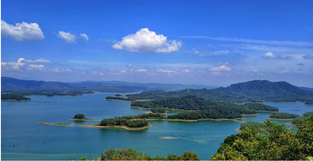
Gambar 1.2. Pemandangan Danau Buatan dari Puncak Kompe

membuat lokasi menjadi viral dan menarik banyak wisatawan. Berikut pemandangan danau buatan beserta gugusan pulau yang dapat dilihat dari Puncak Kompe Kampung Patin.