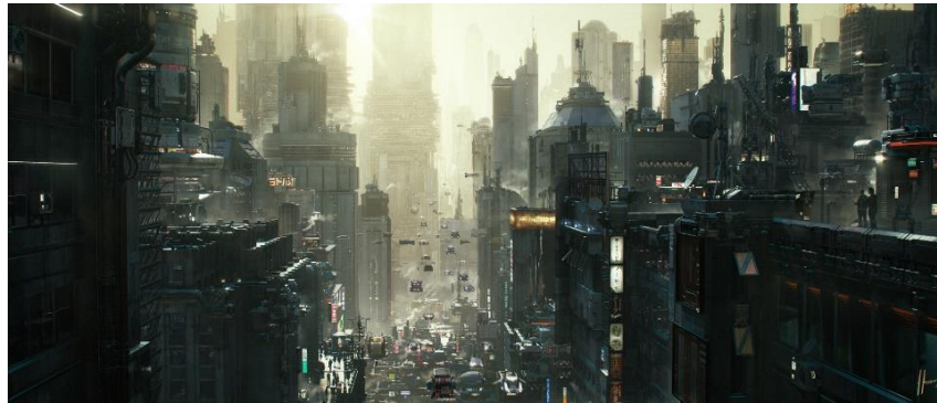
(Gambar 1.1 Karya Jaime Jasso “ Morning Coffe ”)

perkotaan yang menyebabkan polusi semakin parah dan menyebabkan iklim semakin tidak teratur.