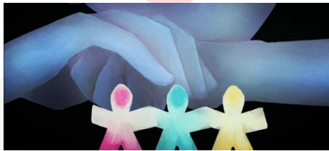
Gambar 4 Screenshot Karya Scene 2 – Shot 2

Menampilkan tokoh utama sedang memandangi kertas orang-orangan, dimana tiap orang memiliki warna yang berbeda. Tiap warna tersebut mempresentasikan pilihan langkah yang akan dipilih oleh tokoh utama. Biru memiliki arti harmoni, percaya diri dan penyembuhan (mempresentasikan tokoh utama yang akan menggeluti dunia ilustrasi secara mendalam), merah memiliki makna dorongan, serta semangat (mempresentasikan tokoh utama yang ingin berkuliah lagi setelah lulus), kuning memiliki arti kehidupan, beruntung dan resiko (melambangkan tokoh utama yang ingin belajar astronomi secara profesional dari nol).