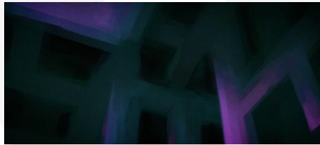
Gambar 2 Screenshot Karya Scene 1 – Shot 1

Shot satu pada scene satu menampilkan jalur bercabang yang tak hingga, dimana jalur ini merupakan representasi dari dunia paralel yang terus bercabang yang didasari oleh teori ilmiah.