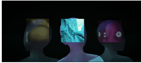
Gambar 7 Screenshot Karya Scene 2 – Shot 9