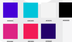
Gambar 1 Warna Visual

Selain itu, penulis menentukan warna-warna yang akan membangun mood visual pada karya, yakni warna-warna yang cenderung gelap dan dipadukan dengan warna vivid tone (warna jelas dan cerah) dan/atau warna neon sebagai warna aksen, pemilihan warna ini bertujuan agar dapat menonjolkan objek yang menjadi fokus atau memberi kehidupan kepada keseluruhan warna karya. Warna-warna yang digunakan akan dipilih secara saksama sesuai dengan narasi yang telah dibuat serta makna psikologis dalam warna, tujuannya agar makna yang terkandung dalam keseluruhan karya tersampaikan dengan baik dan tepat sasaran.