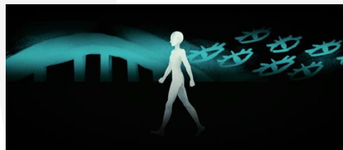
Gambar 9 Screenshot Karya Scene 3 – Shot 1

Menampilkan tokoh utama yang berjalan lurus, hal ini menandakan bahwa tokoh utama sedang menjalani pilihannya. Kulit tokoh utama berwarna putih, dimana putih melambangkan usaha tokoh utama untuk disiplin dalam menjalani apa yang ia pilih.