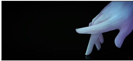
Gambar 5 Screenshot Karya Scene 2 – Shot 3, 5, 7

Tokoh utama menunjuk salah satu kertas orang-orangan. Hal ini mengartikan bahwa tokoh utama telah memilih pilihan yang akan ia jalani.