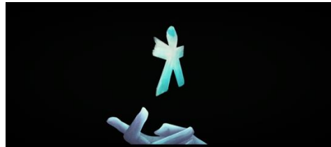
Gambar 8 Screenshot Karya Scene 2 – Shot 10

Kertas orang-orangan berwarna biru melayang di atas tangan tokoh utama. Menandakan bahwa jika sudah memilih satu keputusan dalam satu waktu, maka seseorang harus bertanggung jawab menjalaninya.