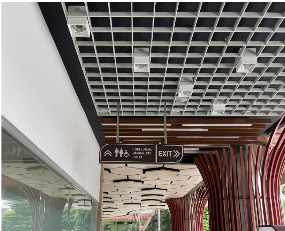
Gambar 1.7.1.4 3 Interior Gedung 3