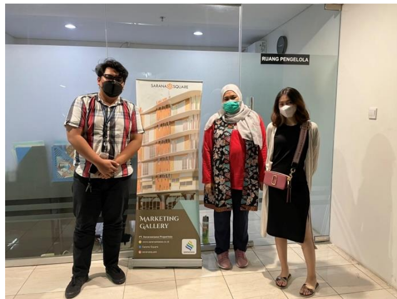
Gambar 1.7.1.1 1 Foto Penulis bersama Narasumber (sumber : dokumen pribadi)