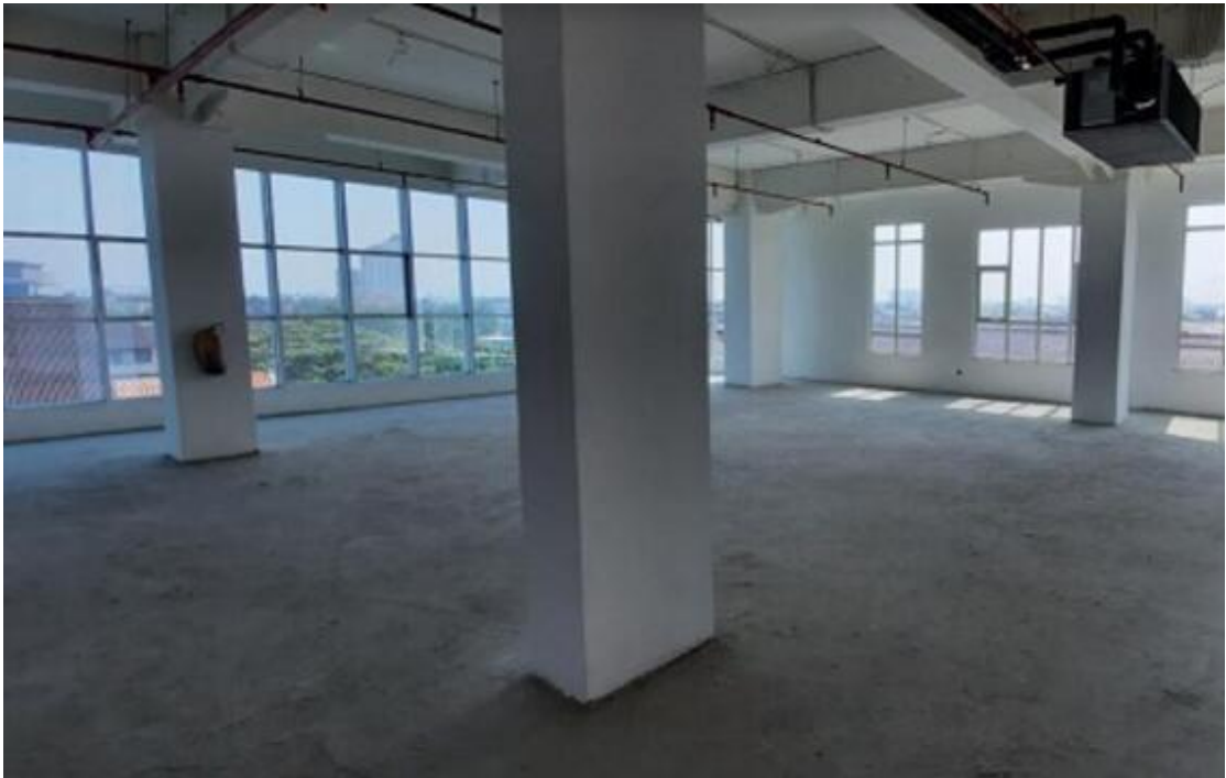
Gambar 1.7.1.4 1 Interior Gedung 1

Kegiatan dokumentasi merupakan kegiatan dimana penulis datang ke lokasi perancangan dan mengabadikan hal-hal penting yang telah dilihat dan teliti yang akan berguna untuk penulisan maupun penelitian. Pada kasus ini, penulis telah mengabadikan data-data penting mengenai lingkungan sekitar gedung, pengguna gedung serta kegiatannya, hingga pengayaan interior maupun eksterior gedung. Selain itu, penulis juga mendapatkan proposal perancangan.