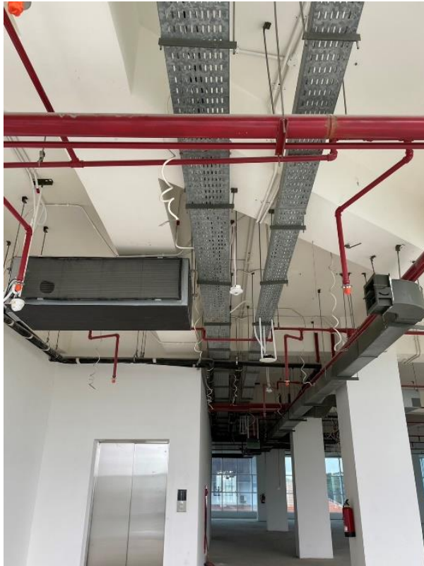
Gambar 1.7.1.4 2 Interior Gedung 2