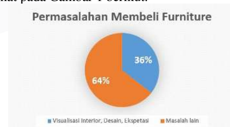
GAMBAR 1 PERMASALAHAN MEMBELI FURNITURE

Sebelum membeli furniture untuk melengkapi ruangan tertentu masyarakat perlu desain interior yang cocok dengan ruangnya. Desain ruangan perlu untuk mengurangi kerugian dari aspek kepuasan dan pengeluaran yang berlebihan. Ketika masyarakat membeli furniture banyak permasalahan yang terjadi, seperti masyarakat bingung visualisasi furniture ke interior ruangnya, desain interior dan furniture yang tidak sesuai selera, harga mahal, lokasi penjualan yang jauh dan lain-lain. Kami sudah mengumpulkan data masyarakat yang mengalami permasalahan ketika membeli furniture . Kami mengumpulkan data dengan metode kuesioner dan wawancara dengan jumlah 183 responden. Hasil yang kami dapatkan dapat dilihat pada Gambar 1 berikut.