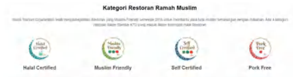
Gambar I- 2 Kategori Halal KTO

Indonesia menjadi salah satu negara yang ikut menyumbangkan pengunjung muslim di Korea Selatan yang meningkat pesat di setiap tahunnya, dengan sample total pengunjung muslim Indonesia yang melakukan perjalanan ke korea sebanyak 1.247.530(CEIC Data, 20219) orang pada Tahun 2015 sampai dengan 2019 yang membuat Indonesia menjadi negara yang menduduki urutan ke – 11 pada data peningkatan jumlah pengunjung muslim Korea Selatan.