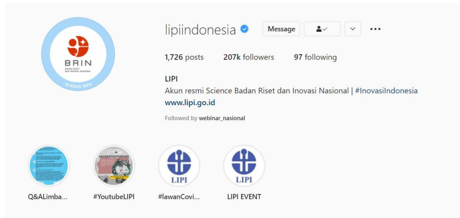
Gambar 1. 1 Instagram LIPI

sosial ini akan menarik lebih banyak perhatian masyarakat agar mau ikut berpartisipasi dalam mengurangi limbah masker di Indonesia.