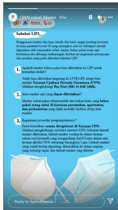
Gambar 1. 2 Informasi mengenai daur ulang limbah masker