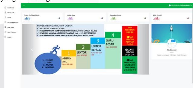
GAMBAR V. 1 (Interface Sistem)