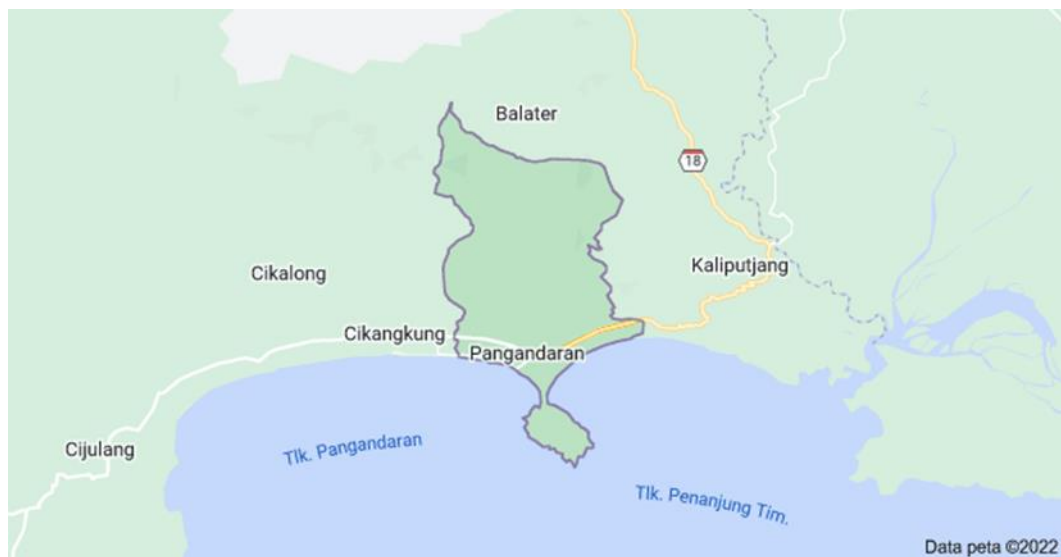
Gambar I. 2. Peta Wilayah Kecamatan Pangandaran, Ciamis

Acara atau event adalah suatu agenda, kegiatan atau festival tertentu yang menunjukkan, menampilkan dan merayakan untuk memperingati hal-hal penting yang diselenggarakan pada waktu tertentu dengan tujuan mengkomunikasikan pesan-pesan kepada pengunjung, Noor (2009). Event di Indonesia ada berbagai macam mulai dari konser, acara wedding, pameran dan lain lain. Dalam sebuah pembuatan acara atau event tentunya membutuhkan berbagai peralatan. Peralatan yang digunakan pada acara atau event biasanya adalah Sound System, panggung, kursi, tenda dan sebagainya. Melihat peluang usaha mengenai sewa peralatan menyebabkan banyaknya orang yang membuka jasa di bidang ini. Salah satu tempat penyewaan peralatan acara atau event adalah perusahaan Gilang Putra yang bertempat di daerah Pangandaran. CV. Gilang Putra memiliki berbagai macam peralatan pesta yang bisa di sewakan, seperti sound system, panggung, enda, kursi dan lain lain. Berikut tampilan peta wilayah kecamatan pangandaran, Ciamis pada gambar 1. 2