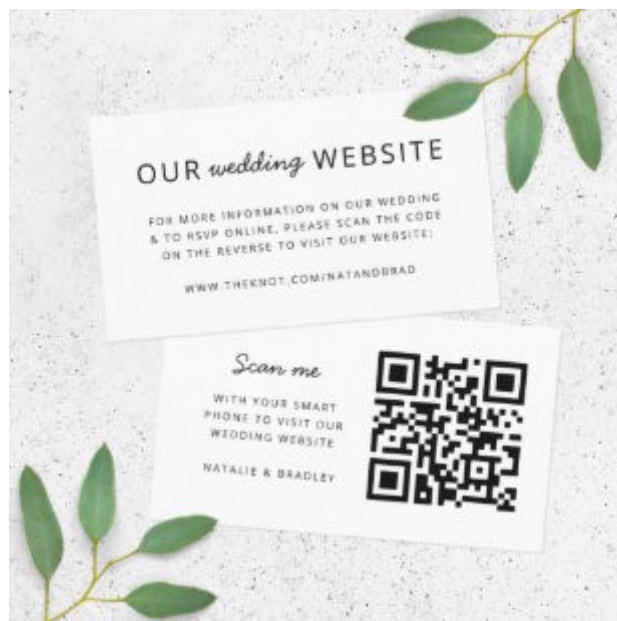
Gambar 1.2 Digital Invitation Based QR Code

Sebelum diperkenalkannya Digital Invitation , undangan pernikahan dikirimkan melalui pos ataupun langsung diberikan kepada penerima undangan. Undangan tersebut dikemas dalam bentuk kertas tebal dengan berbagai macam informasi terkait acara pernikahan di dalamnya. akan tetapi, penggunaan undangan berbentuk kertas ini secara umum mudah rusak dan juga hilang. selain itu dengan cara menggunakan undangan kertas, tamu undangan tidak tersaring dan mudah dimasuki oleh orang-orang yang tidak diundang sebelumnya.