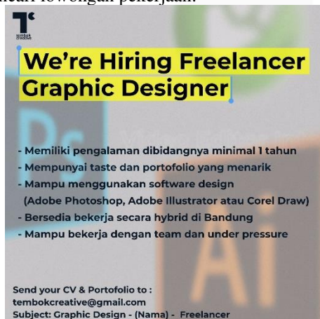
Gambar 3. Hiring freelancer Graphic Designer

Tembok Creative membuat syarat dan ketentuan untuk rekrutmen dan di publikasi pada sosial media perusahaan serta akun - akun sosial media yang menjadi tempat para job seeker mencari lowongan pekerjaan.