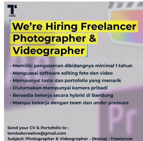
Gambar 4. Hiring Freelancer Photographer & Videographer