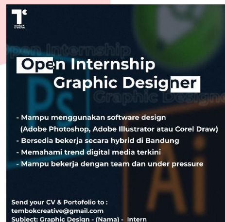
Gambar 5. Hiring Intern Graphic Designer