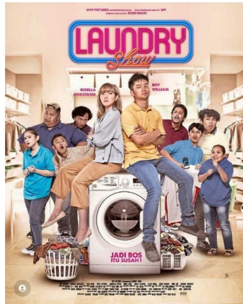
Gambar 1. 2 Poster Official Film Laundry Show

persaingan semakin sukar. Hubungan antara Uki dan Agustina tidak berjalan dengan baik dan sering bertengkar karena merasa adanya persaingan yang tidak sehat yang dirasakan Uki. Namun berkat gaya Kepemimpinan yang baik Uki dalam menghadapi dan mengelola perusahaan, semua permasalahan yang muncul dapat diatasi dengan baik, akhirnya perusahaan Laundrynya dapat berjalan dengan baik dan sukses.