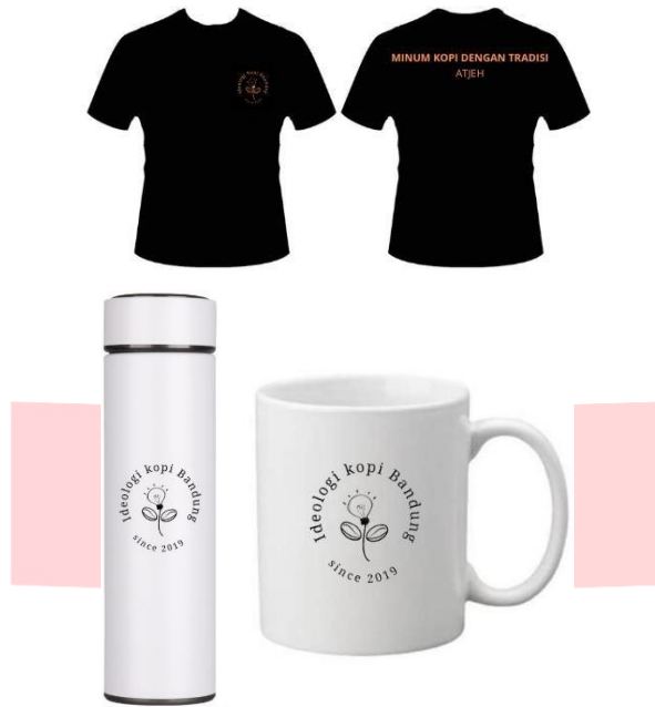
Gambar 6 Merchandise

Merchandise berfungsi sebagai hadiah tambahan juga cinderamata yang diperjual belikan ataupun dibagikan secara cuma-cuma ketika khalayak telah menjadi partisipan di acara yang dibuat Ideologi. Merchandise yang akan didapatkan partisipan seminar adalah kaos dan gelas dengan logo ideologi kopi.