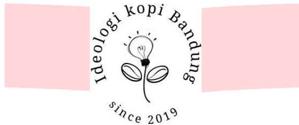
Gambar 1 Logo baru Ideologi