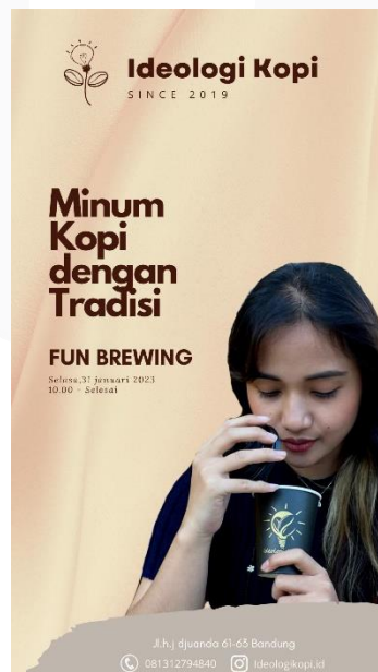
Gambar 5 Poster Produk