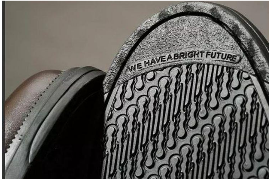
Gambar 1 Brodo Parang