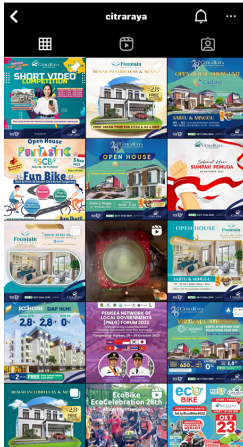
Gambar 1.6 TAMPILAN KONTEN PADA INSTAGRAM @CITRARAYA

Dilihat dari ritme pengunggahan konten pada Instagram Post akun @Citraraya, perbandingan unggahan antara Instagram Feeds dan Instagram Reels sudah proposional, sebagai contohnya dalam 9 Instagram Post terdapat 7 konten yang diunggah sebagai Instagram Feeds dan 2 konten yang diunggah sebagai Instagram Reels . Jika dilihat dari komposisi konten yang ada pada Instagram @Citraraya, sangat minim ditemukan konten edukatif dan lebih berfokus pada pendekatan hard selling dibandingkan soft selling . Konten video hard selling berbasis “reels” pada akun @Citraraya dibuat menggunakan latar musik dan gaya video yang sedang “trend”. Konten yang diciptakan oleh CitraRaya melalui Instagram dalam mempromosikan produk properti, mampu memperluas target audiens, mempengaruhi konsumen hingga konsumen memutuskan untuk melakukan pembelian. Konten-konten yang ada pada Instagram Citra Raya mampu menciptakan komunikasi melalui kolom komentar yang sebagian besar bertanya mengenai pricelist dari produk properti