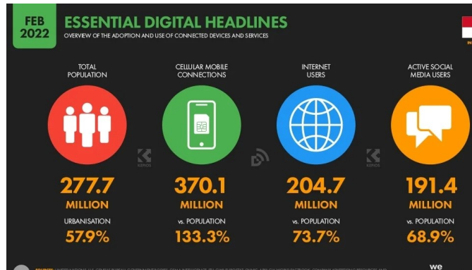
Gambar 1.3 PENGGUNAAN SOSIAL MEDIA 2022

Jika dilihat dari demografi umur yang dijadikan target market utama oleh CitraRaya yaitu generasi Milenial dengan rentang umur 24 sampai 39 tahun, penggunaan Instagram merupakan pilihan yang tepat untuk melakukan pendekatan pada Generasi Milenial. Berdasarkan data yang dirilis oleh Bussines of Apps (dalam Rizaty, 2022), Pengguna Instagram mayoritas berusia 25-34 tahun dengan proposi sebesar 33%. Dengan menggunakan Instagram sebagai media dalam mempromosikan properti, CitraRaya lebih mudah untuk menjangkau target market utamanya yaitu generasi milenial karena adanya keselarasan rentang usia dengan mayoritas pengguna Instagram saat ini.