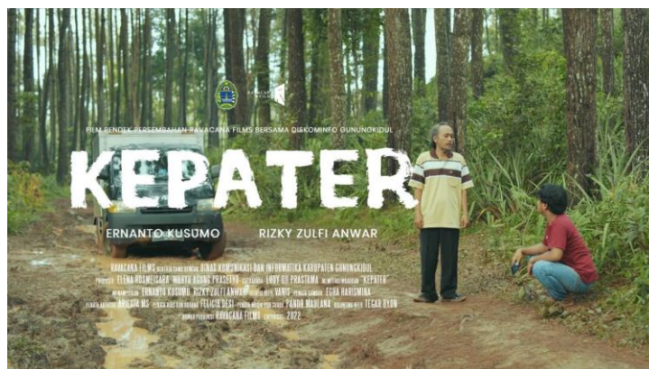
Gambar 1.1 Poster Film