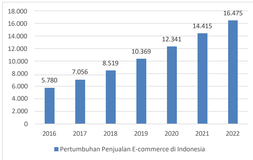
Grafik 1. 1 Pertumbuhan Penjualan E-commerce di Indonesia