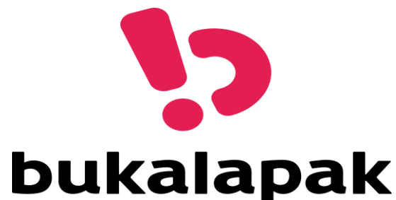
Gambar 1. 1 Logo E-commerce Bukalapak

Logo E-commerce Bukalapak digambarkan pada gambar 1.1: