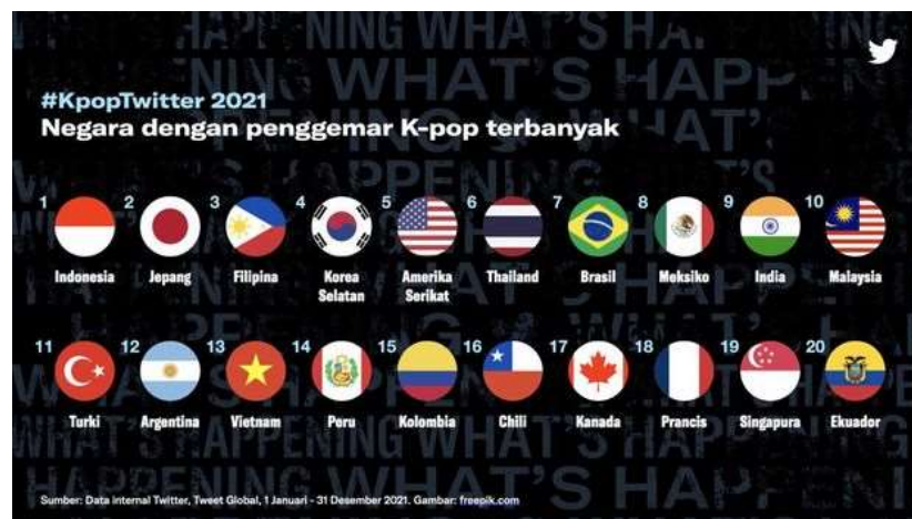
Gambar 1. 1 20 negara dengan penggemar K-Pop terbanyak tahun 2021.

Terpilihnya grup K-Pop sebagai brand ambassador bukan lah hal yang baru bagi produk-produk di Indonesia. Hal tersebut terjadi karena tersebarnya budaya Korea Selatan secara global termasuk Indonesia yang biasa disebut sebagai Korean Wave atau Hallyu . Tidak hanya musik K-Pop , penyebaran Korean Wave juga meliputi film, serial drama, fashion , aktor, aktris, makanan, hingga life style . Di Indonesia sendiri, Korean Wave pertama kalinya tersebar dalam penayangan serial drama Korea Selatan dengan judul “ Autumn In My Heart ” yang tayang di saluran televisi Indosiar pada tahun 2001 (kepo.me diakses 10 November 2022 pukul 16.25 WIB).