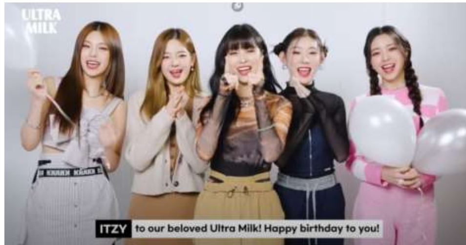
Gambar 1. 4 ITZY untuk Ultra Milk.