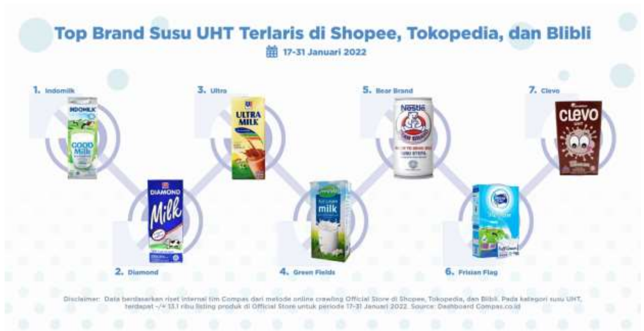
Gambar 1. 3 Top Brand Susu UHT terlaris di e-commerce

Ultra Milk sukses bertahan dalam posisinya pada Top Brand Award fase I 2021. Tahun 2020 produk susu ini mendapatkan skor TBI 31,8% (Annissa Mutia, 2021).