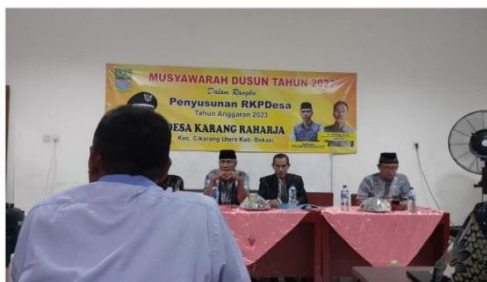
Musyawarah Dusun (MUSDUS) Tahun 2022

Kategori: Pembangunan Tanggal: 21-11-2022