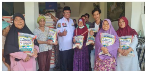
Realisasi Kegiatan Ketahanan Pangan Desa Karangraharja Tahun 2021

Kategori: Pembangunan Tanggal: 21-11-2022