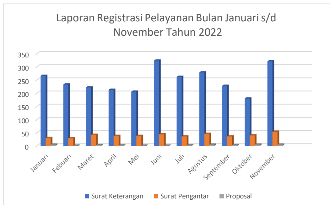
Tabel 1.1 Laporan Registrasi Pelayanan Desa Karang Raharja