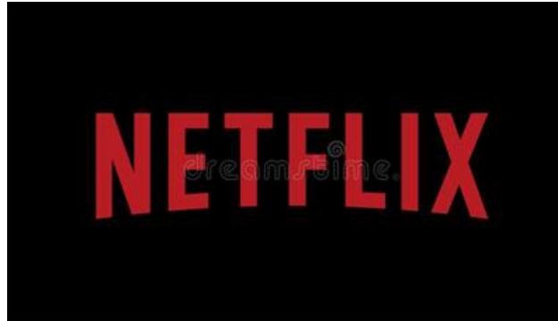
Gambar 1. 2 Logo Netflix