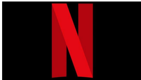
Gambar 1. 3 Logo Netflix

Pada Juni 2014, pemilik layanan streaming melakukan rebranding global dengan bantuan proses dari studio New York Gretel desain. Mereka mengembangkan dan mengubah tampilan pada situs web. Tidak ada bayangan gelap pada logo terbaru, yang sebelumnya membuat persepsi visual menjadi lebih berat. Hanya ada satu nama perusahaan yang terlukis di Netflix Red. Tulisan dibuat dengan font khusus.