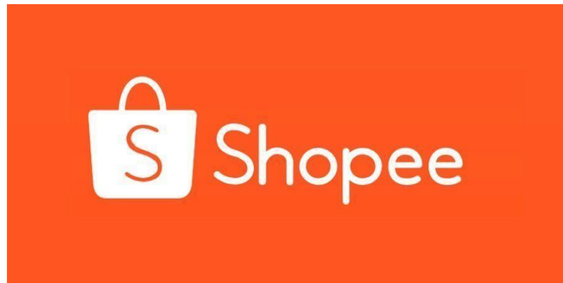
Gambar 1.1 Logo perusahaan