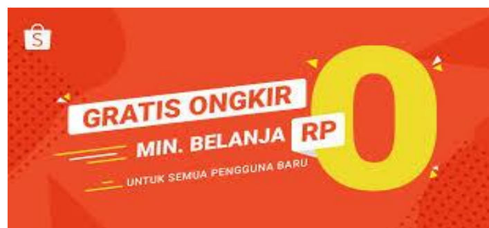
Gambar 1.2 Logo promo diskon ongkir shopee

Shopee menjalankan promosi berdasarkan apa yang sedang populer saat ini. Inovasi yang dimanfaatkan oleh Shopee antara lain free delivery hingga Rp 20.000, limit, cashback, penggunaan brand diplomat, akun Instagram dan Twitter. Shopee memilih Blackpink, Cristiano Ronaldo, Via Vallen, Komeng, dan lainnya sebagai brand Ambassador. Berikutnya adalah kemajuan yang dilakukan Shopee dengan pengiriman gratis, yang dapat dilihat pada Gambar 1.2.