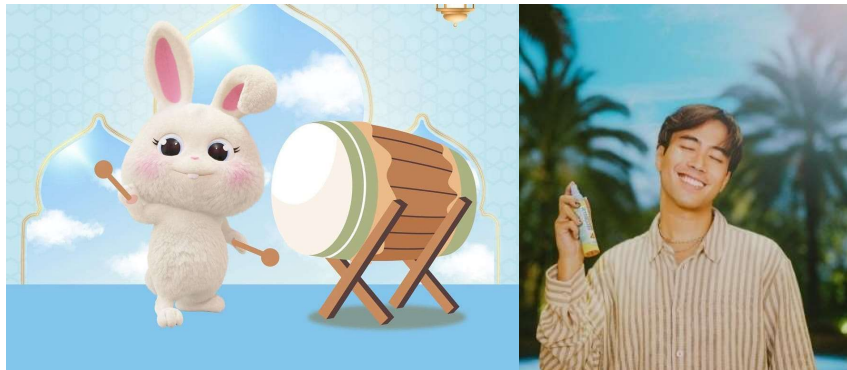
Gambar 1. 2 (Kiri) Gambar maskot Tokki, maskot dari Brand True To Skin, (Kanan) Foto Vidi Aldiano sebagai Brand Ambassador Brand Somehinc

Dua brand kosmetik lokal asal Indonesia, yaitu True To Skin dan Somehinc merupakan dua contoh brand yang menggunakan representatif untuk branding eksternalnya. Brand kosmetik True To Skin menggunakan maskot animasi berbentuk kelinci bernama Tokki. Sedangkan brand kosmetik Somehinc menggunakan brand ambassador penyanyi sekaligus influencer Vidi Aldiano. Kedua representatif tersebut digambarkan sebagai berikut: