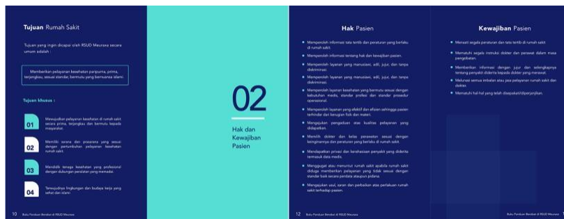
Gambar 5 Tujuan, Hak dan Kewajiban Pasien