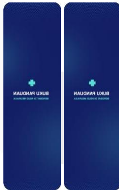
Gambar 15 Pembatas Buku