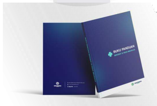
Gambar 2 Cover dan Back Cover