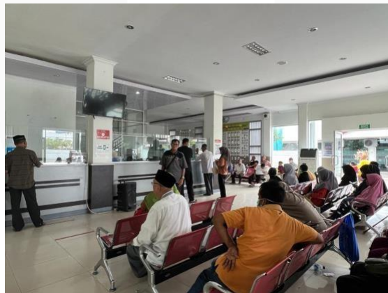
Gambar 1 Observasi Lapangan

Kegiatan observasi dilakukan dengan mengunjungi ruang rekam medis RSUD Meuraxa pada tanggal 18 April 2023, pukul 09:20 WIB. Proses pengamatan dan pengambilan dokumentasi di atas perizinan Kepala Humas RSUD Meuraxa. Dalam ruangan rekam medis ini pasien yang ingin berobat/rawat jalan melakukan pendaftaran atau registrasi sebagai gerbang awal mendapatkan layanan. Berdasarkan pengamatan, pengunjung atau pasien masih melakukan pendaftaran secara manual dengan sebab kurang mengerti menggunakan gadget . Adapun sebab lainnya adalah keterbatasan gadget , maka hanya mengandalkan mulut untuk bertanya ke petugas.