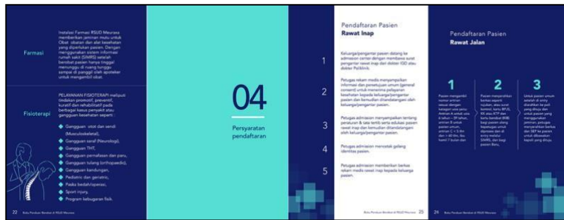
Gambar 8 Pendaftaran Sumber: (Dokumen Pribadi)