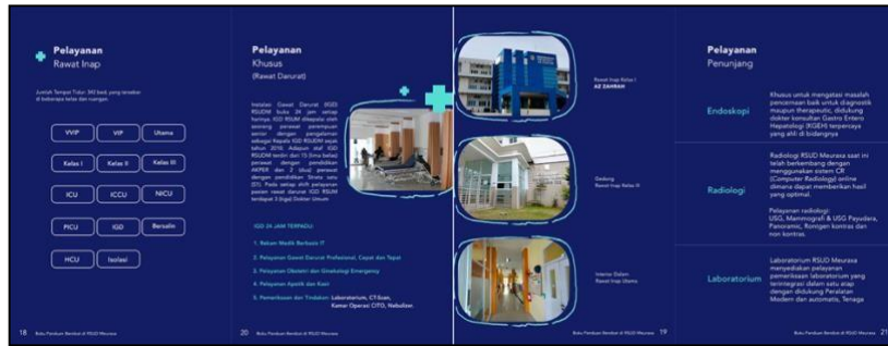
Gambar 7 Pelayanan Rawat Inap, Pelayanan Khusus dan Pelayanan Penunjang