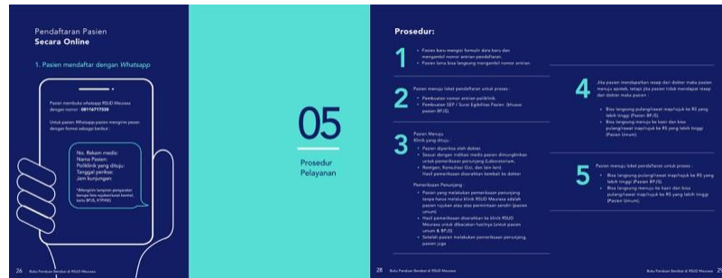
Gambar 9 Prosedur