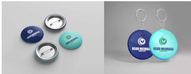
Gambar 16 Pin dan Gantungan Kunci