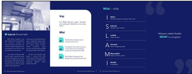
Gambar 4 Sejarah, Visi Misi, Nilai dan Motto