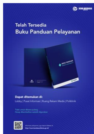
Gambar 12 Poster