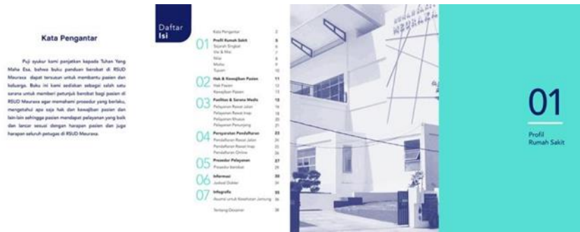
Gambar 3 Kata Pengantar dan Daftar Isi