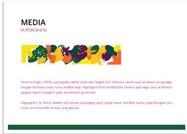
Gambar 3 Supergrafis