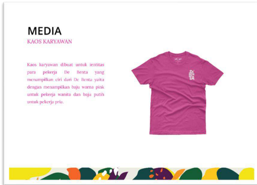
Gambar 7 Kaos Karyawan