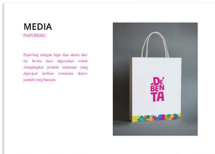
Gambar 8 Kaos Karyawan

Paperbag memiliki fungsi untuk mengangkut produk dalam jumlah yang banyak maupun yang sedikit.