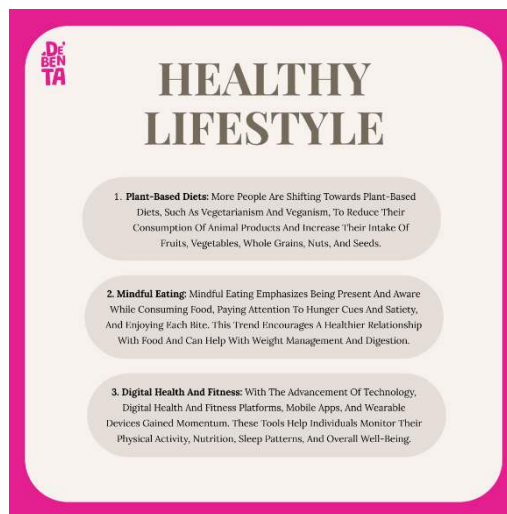
Gambar 2 Media Instagram (Feed) Sumber: Dokumentasi Penulis

Website tampak mobile dibuat berdasarkan hasil analisis dengan kompetitor karena semua kompetitor mempunyai media website dalam melakukan transaksi jual beli sehingga dibuatlah perancangan desain website untuk De Benta.