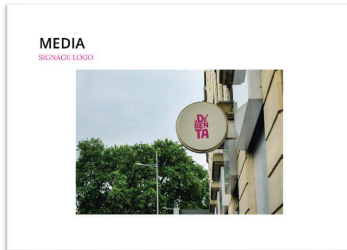
Gambar 4 Signage Logo

Signage logo dibuat sebagai petunjuk jalan oleh calon konsumen yang ingin berkunjung ke De Benta serta dapat memiliki fungsi sebagai media promosi di sekitar toko De Benta.