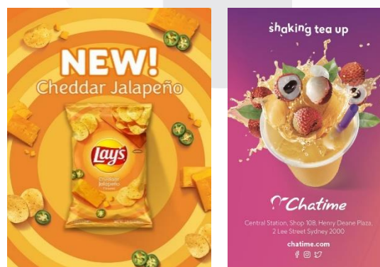
Gambar 4 Referensi Layout

Layout dalam penempatan visual dan copywriting dapat menentukan titik fokus audiens terhadap media yang digunakan. Pada pengaplikasian strategi promosi kali ini, layout yang digunakan didominasi oleh layout simetris sehingga terkesan stabil sehingga audiens dapat langsung terfokus.