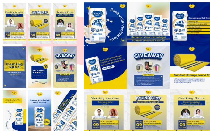
Gambar 8 Rancangan Instagram

Sosial media digunakan sebagai media pendukung untuk mempromosikan produk Tropicana Slim Oat Drink dan event Pound Fest. Pada perancangan media sosial instagram menggunakan gaya komunikasi persuasif informatif, yang dimaksudkan agar pesan yang ingin disampaikan melalui sosial media dapat sampai kepada audiens.