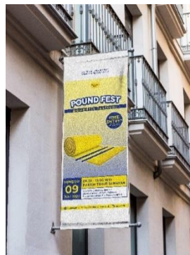
Gambar 7 Rancangan Banner

Media cetak banner digunakan dalam perancangan sebagai media penyampaian terhadap event yang akan dilaksanakan. Banner akan dipasang di public space seperti sekitar tempat gym, mall, jalanan yang ramai dilewati, lapangan untuk mendapatkan perhatian dari masyarakat secara luas.