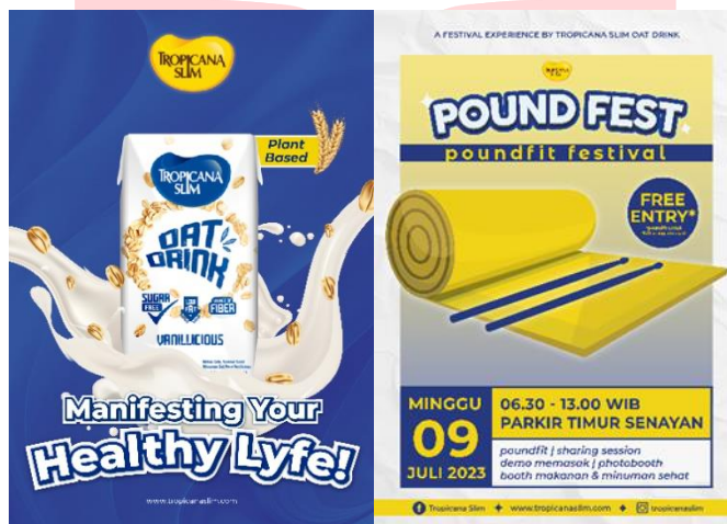
Gambar 6 Rancangan Poster

Media cetak poster dalam perancangan ini digunakan untuk menyampaikan pesan serta informasi mengenai produk Tropicana Slim Oat Drink dan event Pound Fest. Poster tersebut menggunakan layout simetris, sehingga audiens dapat langsung terfokus pada informasi