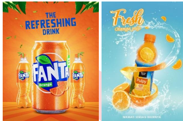
Gambar 3 Referensi Gaya Visual

Gaya visual yang digunakan dalam pengaplikasian strategi promosi kali ini difokuskan terhadap produknya sebagai highlight dari poster tersebut serta ditambahkan penggunaan ilustrasi yang digunakan sebagai visual pendukung dari produknya, kemudian terdapat headline yang mendukung produk tersebut.