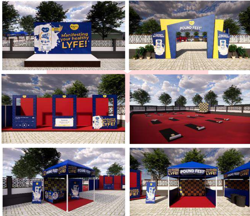
Gambar 5 Rancangan Denah Event

Dengan adanya rundown dari sebuah event yang diadakan, diharapkan agar pelaksanaan dari event tersebut dapat berjalan secara sistematis. Kemudian, ada pula desain rancangan denah dari event “Pound Fest” yang diadakan di Parkir Timur Senayan.