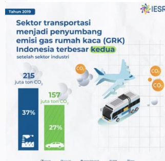
Gambar 1. 2 Sektor Penyumbang Emisi Karbon

Tidak hanya itu, emisi karbon yang dihasilkan kendaraan bermotor juga ikut menyumbang. Tidak hanya itu, emisi karbon yang dihasilkan kendaraan bermotor juga ikut menyumbang. Pada tahun 2019 Indonesia kategori transportasi mengeluarkan emisi sebanyak 157.326 Gg CO2e dengan peningkatan rata-rata sebesar 7,17% per Tahun (Pusat Data dan Teknologi Informasi Energi dan Sumber Daya Mineral Kementerian Energi dan Sumber Daya Mineral, 2020). Kategori transportasi juga menjadi kedua yang terbesar dalam menyumbang emisi karbon menurut Institute for Services Reform (IESR) yang dapat dilihat pada gambar 1.2.