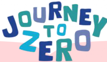
Gambar 1.3 Logo Journey To Zero

(Journey To Zero, 2022). Selain itu kampanye #BirukanLangit merupakan gerakan yang mengajak masyarakat dari berbagai lapisan masyarakat dengan gaya yang akrab melalui tantangan virtual agar menjadi agen perubahan di daerah masing-masing (Kantingan Mentaya Project, 2020). Berawal dari virtual challenge gerakan #Birukan langit kini mulai terintegrasi dengan kegiatan offline .