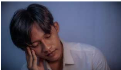
Gambar 4. Mudah Lelah

Kelelahan: Merasa lelah secara fisik dan mental, bahkan setelah istirahat yang cukup.