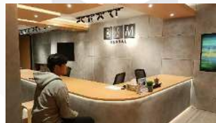
Gambar 14. Sewa Alat