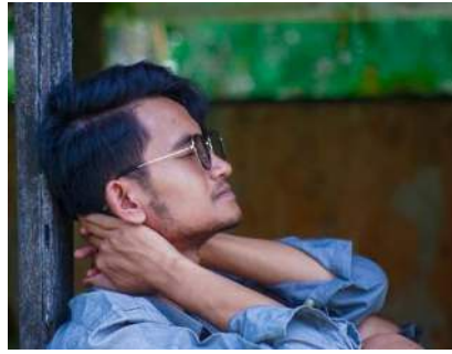
Gambar 6. Gejala Fisik

Psikologi merupakan kata dari bahasa Yunani yaitu psychology yang berasal dari gabungan kata psyche yang berarti jiwa dan logos yang berarti ilmu. Maka dari itu, secara umum dapat dipahami bahwa psikologi merupakan ilmu jiwa. Selain itu, logos juga merupakan kata yang sering diartikan sebagai logika dan nalar.