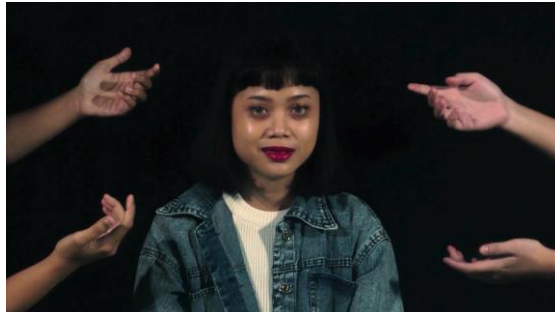
Gambar 24. Mendapatkan Dukungan dan Ekspresi Senang

Kendala-kendala ini meliputi rasa malas yang menghampiri, deadline yang menimbulkan tekanan, tuntutan dari pasangan untuk selalu ada di sampingnya, permasalahan ekonomi, dan revisi yang tak henti-hentinya menghampirinya.