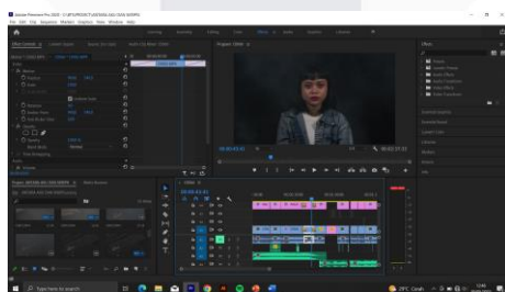
Gambar 9. Proses Editing

Post-produksi film adalah fase pasca pengambilan gambar yang mencakup beberapa kegiatan yang berkaitan dengan penyuntingan, penyuntingan, dan penyelesaian film. Fase ini