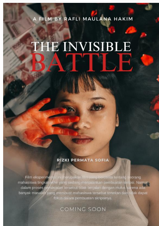
Gambar 10. Poster Film

Sinopsis film adalah ringkasan singkat yang memberikan gambaran tentang cerita, tema, dan alur film. Sinopsis ini dimaksudkan untuk memberikan gambaran kepada pembaca atau calon penonton tentang film tersebut tanpa terlalu banyak detail atau mengungkapkan sepenuhnya perubahan besar atau alur cerita.