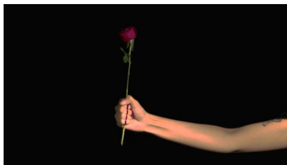
Gambar 23. Menggenggam Bunga Mawar dan Meneteskan Darah

Namun, perjalanannya tidak berjalan dengan lancar karena dihadapkan pada sejumlah kendala yang mengakibatkan ia merasa tertekan dan sulit untuk fokus pada penyelesaian skripsinya.