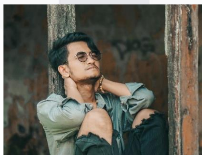
Gambar 1. Merasa Cemas

Perubahan suasana hati: Merasa cemas, mudah marah, atau mudah tersinggung.