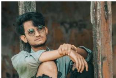
Gambar 5. Tidak Fokus

Penurunan konsentrasi: Kesulitan dalam fokus dan kinerja yang menurun.