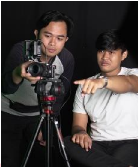
Gambar 8. Penyutradaraan

Proses produksi film adalah saat di mana semua elemen yang telah dipersiapkan dalam pra-produksi mengambil bentuk nyata dan terjadi kolaborasi antara berbagai tim dan individu untuk menciptakan gambar yang sesuai dengan visi dan rencana. Produksi film adalah tahap yang paling intens dan dapat memakan waktu dalam pembuatan film.