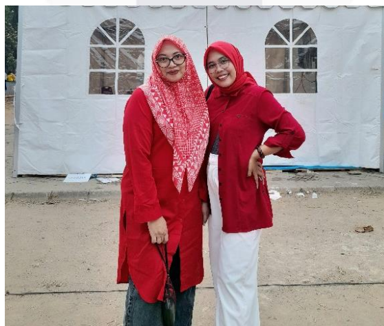
Gambar 11. Berpakaian Warna Merah

Seperti yang kita tau, warna merah merupakan warna yang mencolok sehingga warna tersebut banyak mengundang perhatian dari setiap mata yang memandang dibandingkan dengan warna lain.