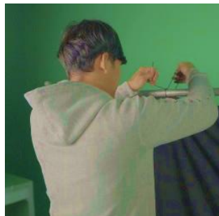
Gambar 15. Pemasangan Backdrop