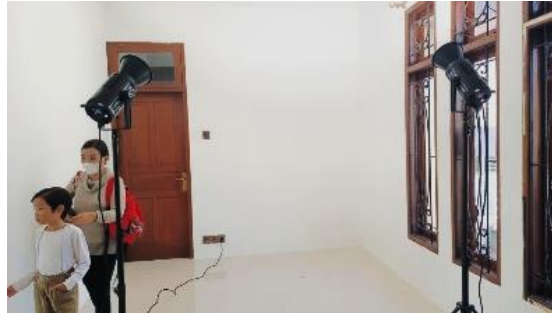
Gambar 7. Setup Lighting

Sinematografi melibatkan pemilihan pencahayaan yang tepat untuk menciptakan atmosfer yang sesuai dengan cerita. Ini melibatkan penggunaan cahaya alami atau cahaya buatan, serta pemilihan sumber cahaya, intensitas, dan warna yang tepat. Sinematografer juga mempertimbangkan tekstur pencahayaan dan kontras yang dapat memberikan kedalaman dan dimensi visual kepada gambar.