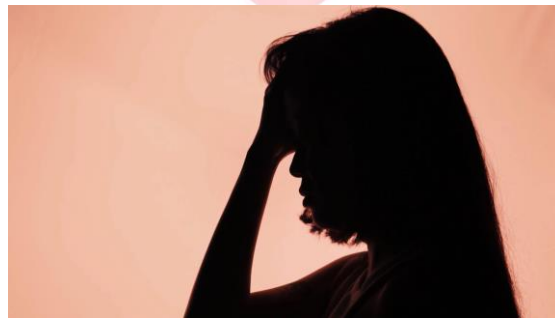
Gambar 22. Siluet Ekspresi Stres

The Invisible Battle Merupakan film eksperimental yang masing-masing scene mempunyai makna semiotika jika dilihat dan dicermati dengan baik. Cerita ini mengisahkan mengenai seorang mahasiswa tingkat akhir yang sedang melaksanakan proses penulisan skripsi.