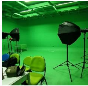
Gambar 13. Survey tempat

Hingga pada akhirnya penulis memutuskan untuk mengulang proses pembuatan film dengan persiapan yang lebih matang agar tidak terjadi kesalahan kembali di pengambilan gambar berikutnya. Berikut merupakan proses syuting kedua.