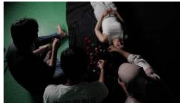
Gambar 17. Proses pemotretan poster