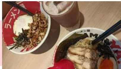
Gambar 3. Sulit Makan

Perubahan perilaku makan: Kehilangan nafsu makan atau makan berlebihan.