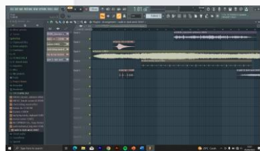
Gambar 20. Pembuatan Backsound