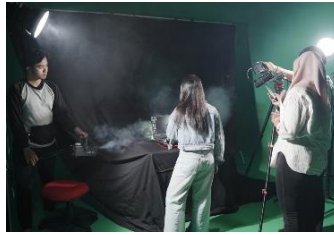
Gambar 16. Proses Syuting