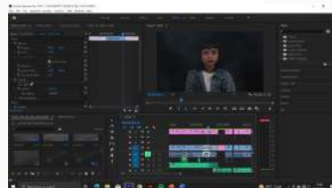
Gambar 19. Editing Video