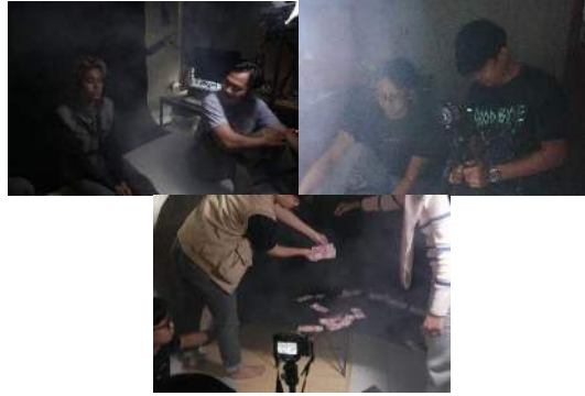
Gambar 12. Trail and Error

Kegagalan itu terjadi karena minimnya lighting saat proses pembuatan film yang menyebabkan terjadinya noise pada hasil video.