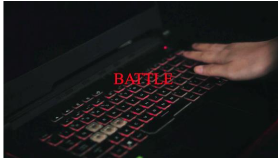
Gambar 21. Hasil Karya Film Eksperimental

The Invisible Battle Merupakan film eksperimental yang masing-masing scene mempunyai makna semiotika jika dilihat dan dicermati dengan baik. Cerita ini mengisahkan mengenai seorang mahasiswa tingkat akhir yang sedang melaksanakan proses penulisan skripsi.