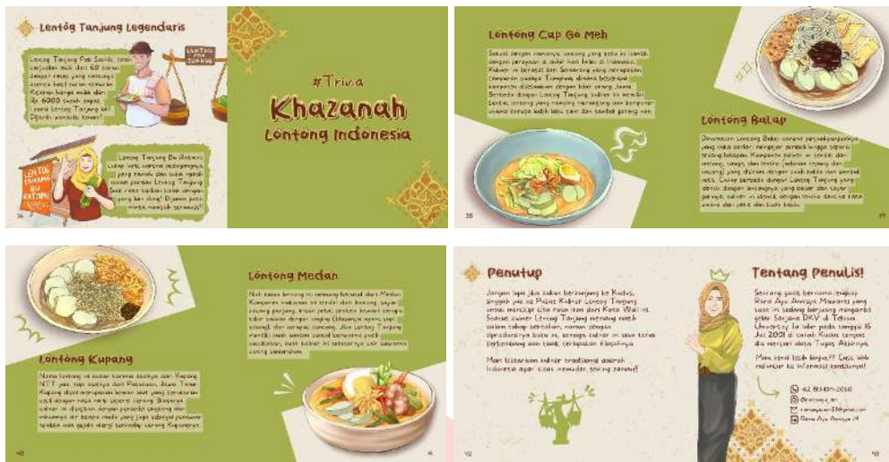
Gambar 6 Isi Buku