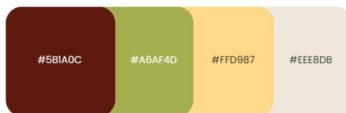
Gambar 2 Warna