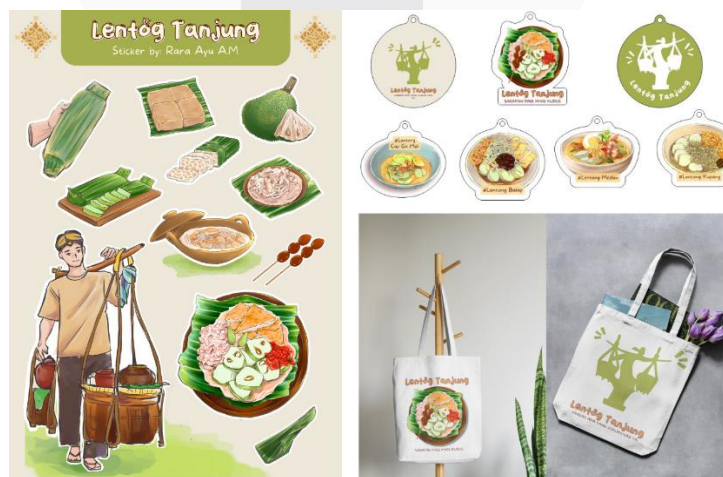
Gambar 7 Merchandise

Media pendukung merchandise terdiri dari stiker, totebag, dan gantungan kunci merupakan bagian bonus dari pembelian buku ilustrasi Lentog Tanjung jika sudah diproduksi. Tujuan media pendukung ini untuk menambah ketertarikan target sasaran agar membeli buku ilustrasi Lentog Tanjung dan jika merchandise digunakan oleh audiens, kemungkinan mampu menarik minat audiens lainnya.