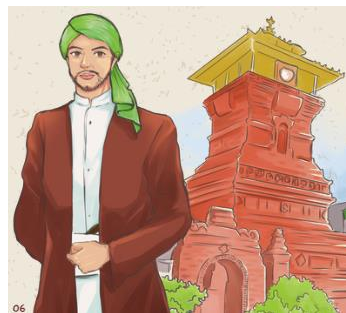
Gambar 4 Ilustrasi