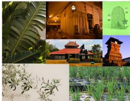
Gambar 1 Moodboard