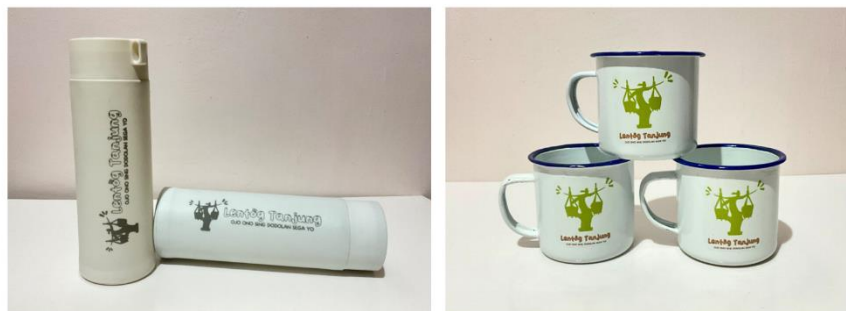
Gambar 9 Media Pendukung Tambahan

Media pendukung tambahan berupa gelas dan tumblr sebagai media yang akan dijual jika audiens yang telah membeli buku dan tertarik untuk mencoba kuliner Lentog Tanjung dan nanti akan dipakai untuk minum saat sedang menyantap kuliner tersebut.