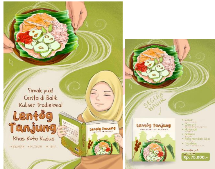
Gambar 8 Poster

Poster yang dicetak berukuran A2 berupa perkenalan buku Ilustrasi Lentog Tanjung yang bersifat persuasif dan poster A4 berupa spesifikasi dan pre-order buku ilustrasi apabila buku diproduksi. Media pendukung dibuat sebagai bentuk promosi buku ilustrasi Lentog Tanjung.