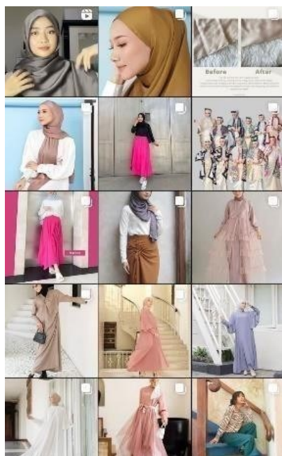
Gambar 1. 2 Produk dan Layanan Riyani The Label