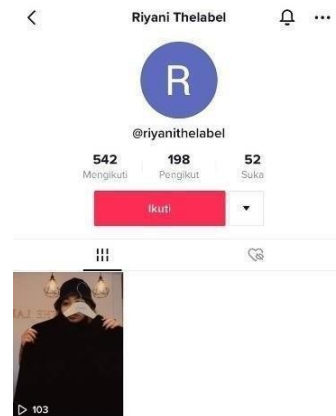
Gambar 1. 4 Tiktok Riyani The Label

memasarkan produknya. Pemilik UMKM ini sangat ingin mengembangkan konten marketing dan meningkatkan penjualan pada Tiktok UMKM nya, akan tetapi karena owner tidak memiliki waktu luang untuk mengelola akun Tiktok. Hal ini bisa dilihat melalui postingan dan penjualan oleh UMKM ini. Berdasarkan hal tersebut dapat disimpulkan bahwa UMKM tersebut belum mampu untuk memanfaatkan pemasaran social media dan menyebabkan kurang minatnya pelanggan terhadap UMKM Riyani The Label.