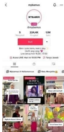
Gambar 1. 5 Pesaing Perusahaan