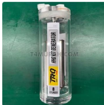
Gambar 1. 2 Generator HHO

Alat generator dipasaran dapat dibilang mahal dengan fitur yang dimilikinya berupa generator tanpa kelengkapan seperti monitoring , controlling , dan sebagainya. Berdasarkan data yang didapatkan, harga untuk alat generator HHO berkisar diantara Rp1.000.000 – Rp2.000.000 di e-commerce Tokopedia. Gambar 1.2 merupakan generator HHO yang telah beredar dipasaran.