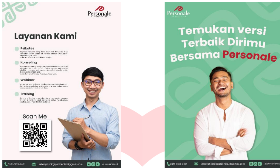
Gambar 2 Poster

Poster ini bisa diaplikasikan pada media digital dan media cetak, digunakan pada tahapan Attention bertujuan untuk menarik perhatian calon konsumen berisi tentang ajakan persuasif dan informasi layanan biro psikologi personale serta info lengkap kontak personale yang bisa digunakan untuk menggunakan jasa perusahaan. Poster disebar pada saat PT Personale Peduli Potensi melakukan kegiatan seminar, pelatihan, dan psikotes.