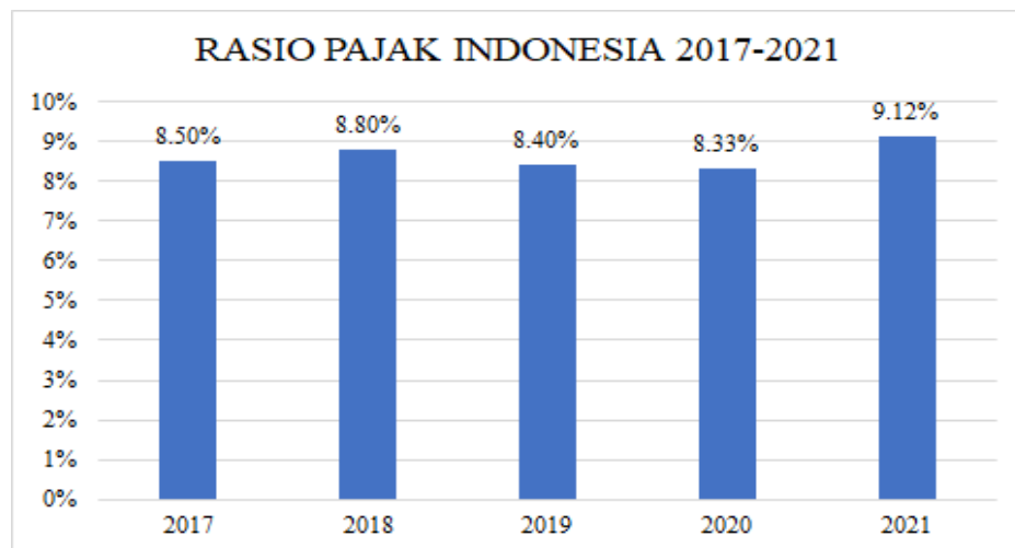
Gambar 1. 2 Rasio Pendapatan Negara Dari Pajak 2017-2021

Salah satu langkah untuk mengukur optimalisasi administrasi perpajakan suatu negara dalam rangka menghimpun penerimaan pajak adalah dengan menggunakan rasio pajak. Rasio pajak ( tax ratio ) digunakan untuk menunjukkan kemampuan pemerintah dalam mengumpulkan penerimaan pajak (Biro Analisa Anggaran dan Pelaksanaan APBN-SETJEN DPR-RI). Menurut kemenkeu.go.id, Rasio pajak ( tax ratio ) adalah perbandingan atau persentase penerimaan pajak terhadap produk domestik bruto (PDB) yang juga merupakan salah satu indikator untuk menilai kinerja penerimaan pajak. Berikut rasio pajak pada tahun 2017 hingga 2021 yang disajikan dalam grafik pada gambar 1.2