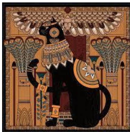
Gambar 1.2 "Kucing" Dewi bast

Pada zaman Mesir kuno tepatnya 3500 SM, kucing dianggap hewan penjelmaan dari Dewi Bast yang dimana Dewi Bast dipercaya bahwa ia adalah pelindung. Para petani mengandalkan para kucing untuk mengacam atau mengusir hama yang merusak ladang mereka. Kehadiran kucing di landang membuat hama seperti tikus itu pergi. Maka dari itu kucing pada zaman dahuu disembah oleh bangsa Mesir kuno.