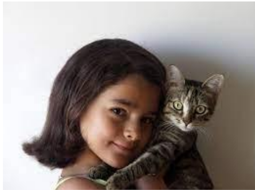
Gambar 1.3 Kucing dan Manusia

Berdampingan dengan hewan peliharaan memanglah menyulitkan, tetapi dengan memelihara hewan peliharaan juga bermanfaat untuk menghilangkan stress yang sementara atau mengurangi ketegangan di pikiran sehabis melakukan pekerjaan.