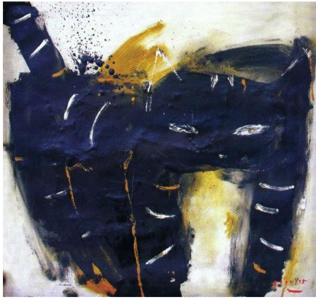
Gambar 1.4 Kucing "Cat" Lukisan Popo Iskandar

Dengan pemaparan latar belakang diatas, penulis bertujuan untuk memvisualisasikan pendapat terhadap objek kucing. Maksud dari pembahasan latar belakang adalah untuk menjadikan karya seni sebagai sebuah ajakan bahwa kucing adalah binatang yang menggemaskan.