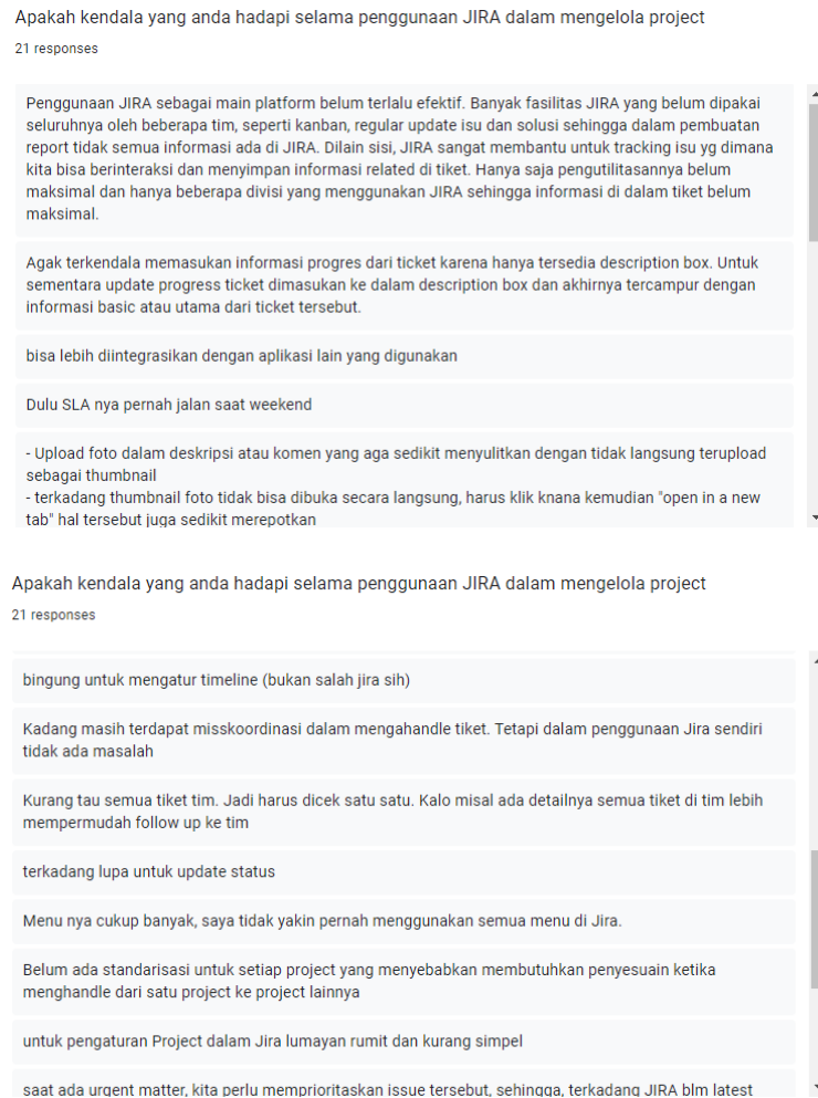
Gambar 1.3 Kendala Pengguna

dalam proses penggunaannya seperti pada Gambar 1.3 yang merupakan hasil penyebaran kuesioner kepada 21 pegawai PT. XYZ untuk mengetahui kendala pegawai dalam penggunaan Jira di PT.XYZ.