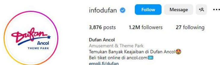
Gambar 1.7 Bukti Ancol Sebagai Parent Brand