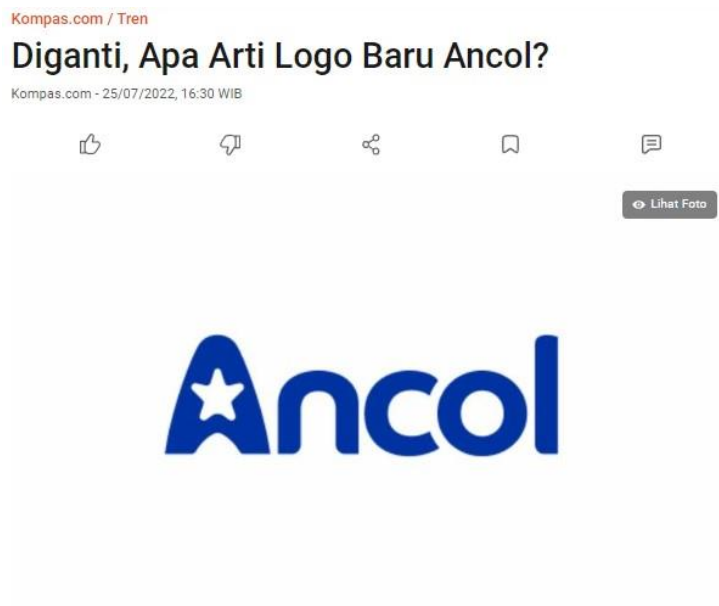
Gambar 1.3 Kampanye Sosialisasi Logo Baru Ancol di Media Berita Online

Selain dari media sosial Twitter dan Instagram, juga terdapat kampanye logo baru Ancol yang diunggah melalui media massa: