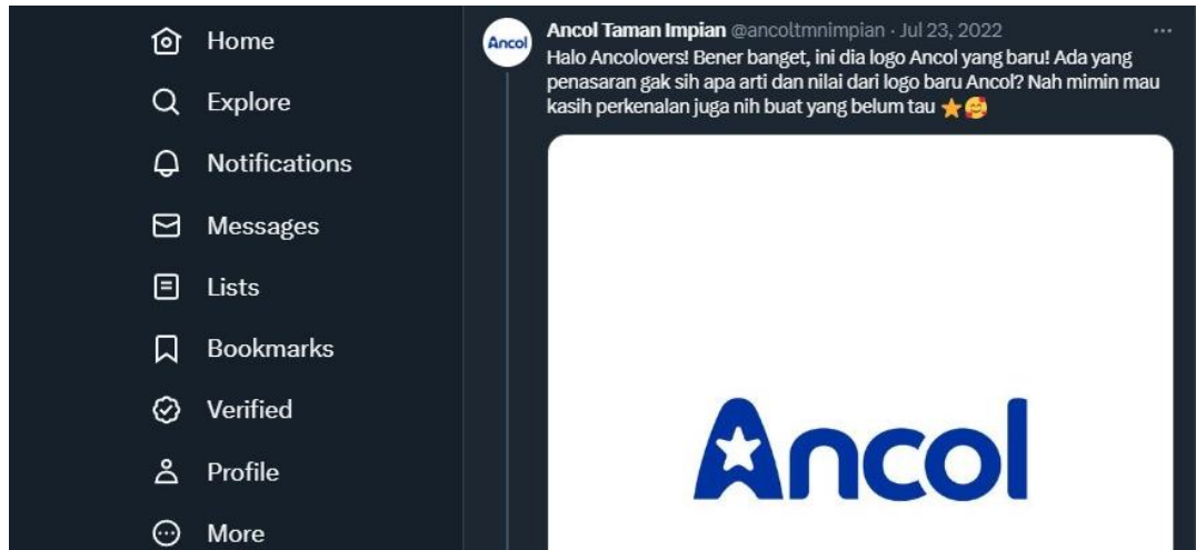
Gambar 1.2 Kampanye Sosialisasi Logo Baru Ancol di Twitter