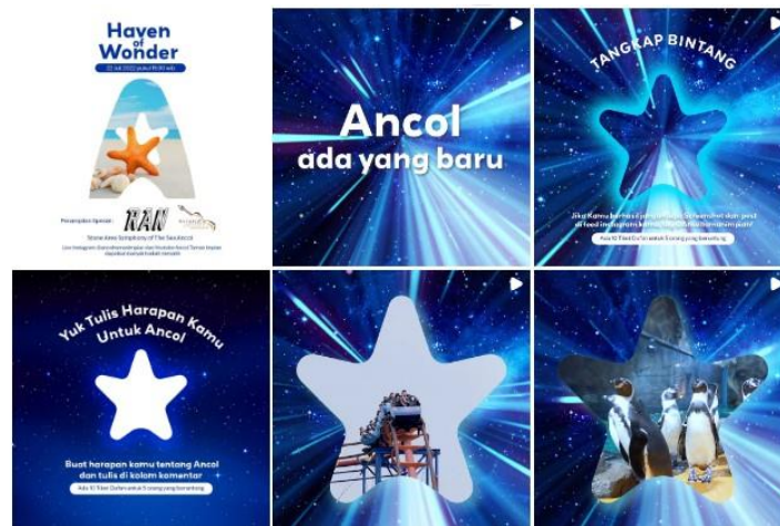
Gambar 1.1 Kampanye Sosialisasi Logo Baru Ancol di Instagram

Selama 30 tahun Ancol berdiri terpantau sudah tiga kali berganti logo dan untuk memperingati hari jadinya pada tanggal 22 Juli 2022, Ancol meresmikan logo baru dengan tema “ Haven of Wonder ”. Tidak hanya perubahan logo, tetapi juga nama Taman Impian Ancol juga berubah menjadi Ancol Taman Impian. Untuk menginformasikan hal tersebut, pihak Ancol melakukan berbagai upaya kampanye sosialisasi logo baru ini baik melalui website, acara perilisan logo, maupun di media sosial, diantaranya Instagram, TikTok, Twitter, dan Facebook sebagai medianya. Selain itu pihak Ancol juga melakukan kampanye sosialisasi melalui media berita daring sebagai bentuk media relations . Untuk melakukan kampanye sosialisasi logo tersebut tentu akan memerlukan peran humas. Berikut upaya kampanye sosialisasi logo baru Ancol yang diunggah pada akun media sosial Ancol dan media berita daring: