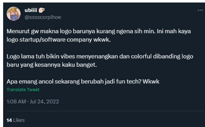
Gambar 1.4 Respon Audiens Pada Logo Baru Ancol di Twitter

respon publik terutama respon yang tidak memiliki tone positif. Respon publik tersebut dapat dilihat melalui beberapa komentar pada postingan pengenalan logo baru di media sosial dan juga beberapa media daring menjadikan hal itu sebagai headline berita mereka. Salah satu pengikut Twitter Ancol @ancoltnnimpian memberikan respon yang sudah disukai sebanyak 14 likes pada unggahan pengenalan logo pada tanggal 23 Juli 2022 yang berisi, “Menurut gw makna logo barunya kurang ngena sih min. Ini mah kaya logo startup/software company wkwk. Logo lama tuh bikin vibes menyenangkan dan colorful dibanding logo baru yang kesannya kaku banget. Apa emang ancol sekarang berubah jadi fun tech? Wkwk”.