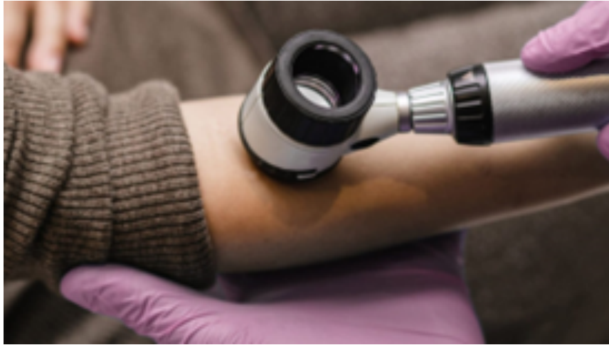
Gambar 1.2 Alat Dermoscope

Akan tetapi, dermoscope ini memiliki harga yang tinggi bisa mencapai 20 juta rupiah sampai 30 juta rupiah [10] dan hanya dapat digunakan oleh tenaga medis yang terlatih agar mendapatkan hasil yang akurat dan efektivitas tinggi selain itu, dermoscope juga hanya bisa melakukan perbesaran pada lesi yang di periksa [10].