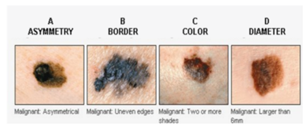
Gambar 1.1 Metode ABCDE

Menurut artikel dari Department of Dermatology, University of Alabama at Birmingham , yang ditulis oleh J. Daniel Jensen MD dan Boni E. Elewski MD, dengan judul “ The ABCDEF Rule: Combining the “ABCDE Rule” and the “Ugly Duckling Sign” in an Effort to Improve Patient Self-Screening Examinations ”. Menyatakan bahwa berdasarkan American Academy of Dermatology, metode ABCDE ini telah meningkatkan awareness terhadap penyakit melanoma [7].