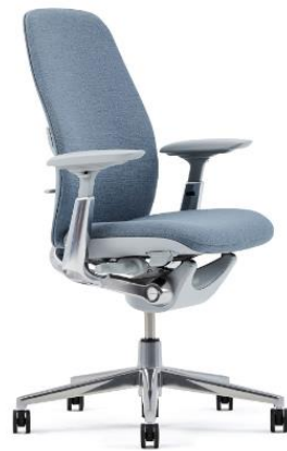
Gambar 2. 5 Kursi Haworth

Kursi Haworth juga merupakan merek yang terkenal dalam kursi kerja ergonomis. Kursi ini menggabungkan desain ergonomis dengan estetika modern. Kursi Haworth menggunakan material yang berkualitas dalam pembuatannya, dirancang memiliki durability yang kuat untuk dapat digunakan dalam jangka waktu yang panjang dan memberikan garansi untuk dapat memberikan rasa aman dan nyaman kepada penggunanya [39].