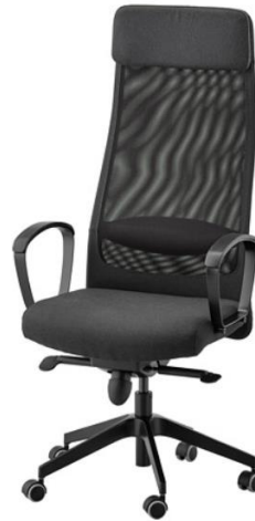
Gambar 2. 6 Kursi IKEA

IKEA juga menyediakan beberapa opsi kursi kerja ergonomis yang terjangkau. Meskipun harga lebih terjangkau, kursi IKEA Markus ini tetap menawarkan fitur-fitur ergonomis yang dapat memenuhi kebutuhan antropometri pengguna ketika duduk. Akan tetapi kekurangan dari kursi ini yaitu minim bagian yang bisa di adjust [40].