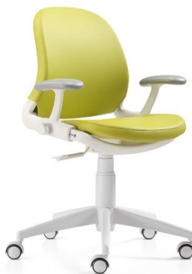
Gambar 2. 4 Kursi Vonti