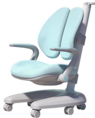
Gambar 2. 3 Kursi Igrow

Igrow Technology juga merupakan merek terkenal dalam industri kursi belajar anak. Produk kursi dari Igrow Technology ini memiliki desain sandaran punggung yang bisa di sesuaikan ketinggiannya sesuai dengan kebutuhan pengguna. Kekurangan dari kursi ini yaitu pada di bagian dudukan kursi tidak bisa di adjust naik turun. Kursi Igrow Technology terbuat dari material berkualitas tinggi, sehingga dapat digunakan dalam waktu yang lama dan dapat dipastikan aman untuk digunakan anak-anak [37].