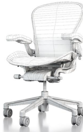
Gambar 2. 2 Kursi Herman Miller

Herman Miller adalah salah satu merek terkenal dalam kursi kerja ergonomis. Produk ini didesain dengan memperhatikan kenyamanan postur duduk pengguna, akan tetapi kekurangan produk kursi ini tidak memiliki sandaran kepala. Build quality kursi Herman Miller tidak patut diragukan lagi mempunyai durability yang sangat kuat dan memiliki garansi selama 12 tahun [36].