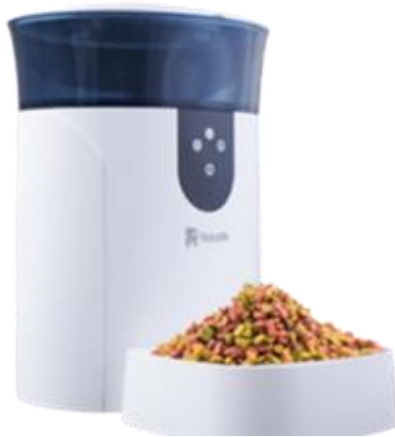
Gambar 1.6 Robolife Smart Pet Feeder Automatic

Pet Feeder ini memungkinkan pemilik hewan untuk mengatur jadwal makan hewan peliharaan secara otomatis melalui smartphone . Pet Feeder ini perlu terhubung dengan Wi-Fi agar dapat dikendalikan dari jarak jauh. Jika tidak terhubung dengan Wi-Fi , pet feeder tetap dapat digunakan secara manual dengan menekan tombol feeding pada alat tersebut. Setiap kali makanan keluar, pet feeder ini memberikan porsi sebanyak 10-20 gram dan pengaturan porsi makanan ditunjukkan dengan angka pada aplikasi. Pemilik dapat mengatur hingga 20 porsi makan dalam satu waktu [10].