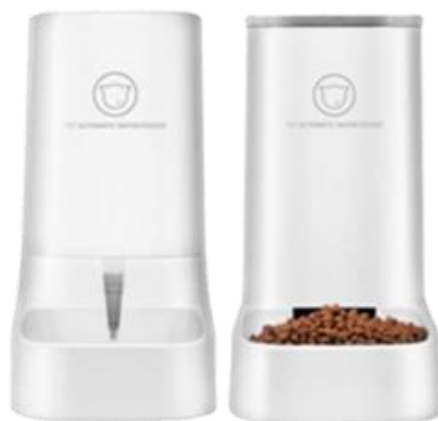
Gambar 1.5 Angola Pet Feeder Otomatis M03

Pet Feeder ini memiliki tempat makan dan minum secara terpisah dan mengeluarkan makanan dan minuman secara otomatis terus menerus, dan bahannya terbuat dari bahan berkualitas food grade PP BPA Free yang aman bagi hewan peliharaan akan tetapi tidak bisa di kontrol dengan handphone [10].