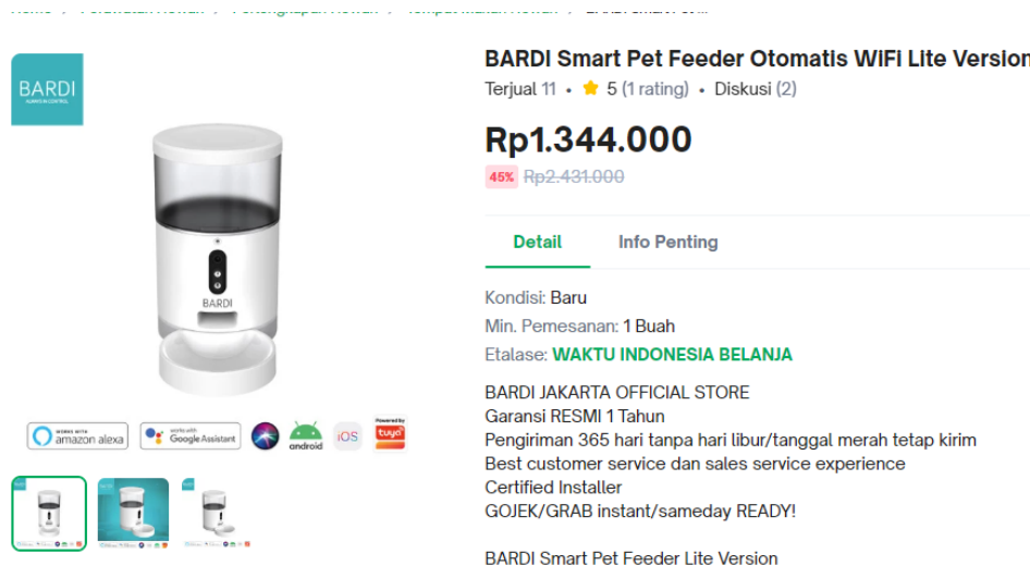
Gambar 1.2 Bardi Smart Pet Feeder

Pet Feeder hadir dengan fitur-fitur yang canggih seperti kamera real time untuk memungkinkan pemilik memantau hewan peliharaannya melalui aplikasi, adanya fitur penjadwalan otomatis untuk mengatur jadwal pemberian makanan sesuai waktu yang ditentukan, fitur mikrofon untuk berkomunikasi dengan hewan peliharaan mereka secara jarak jauh, asisten virtual yang terintegrasi seperti Amazon Alexa atau Google Assistant , dan fitur canggih lainnya. Fitur-fitur tersebut membuat Pet Feeder ini menjadi mahal dengan mempertimbangkan teknologi yang canggih, desain aplikasi, pengembangan alat dan integrasi teknologi sehingga meningkatkan biaya produksi [6].