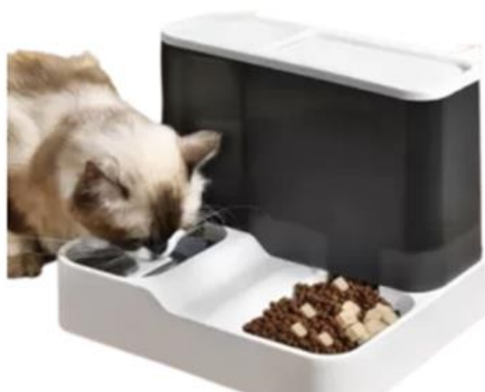
Gambar 1.7 ALOBON Dispenser Automatic

Tempat makan dan minum yang dirancang secara praktis sebagai dispenser makanan untuk hewan peliharaan. Dengan desainnya yang fungsional, alat ini memudahkan dalam