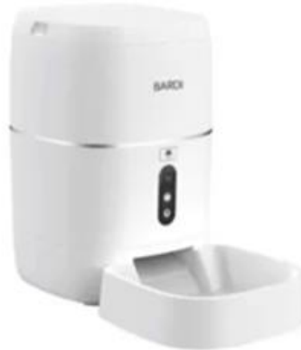
Gambar 1.8 BARDI Smart Pet Feeder Wi-Fi

BARDI Pet Feeder memiliki fitur Wi-Fi 2.4GHz dan aplikasi BARDI Smart Home , pemilik dapat mengatur jadwal pemberian makanan untuk hewan peliharaan dengan pengaturan porsi makanan ditunjukkan dengan angka. Dilengkapi dengan kamera, BARDI Pet Feeder memungkinkan untuk memantau hewan peliharaan secara visual. Speaker system dua arah juga tersedia, memungkinkan untuk berinteraksi, melihat, dan memanggil hewan peliharaan [10].