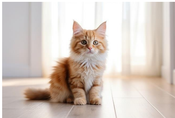
Gambar 1.1 Ilustrasi Kucing

Kucing adalah hewan peliharaan yang cerdas, menggemaskan, dan memerlukan perawatan yang baik. Mereka membawa banyak manfaat emosional dan fisik bagi pemiliknya [1]. Kucing juga mempunyai banyak jenis seperti Turkish Van , Angora , Ragdoll , Russian Blue , British Shorthair , Persian , Cornish Rex , Korat , Bengal , Norwegian Forest Cat , Maine Coon , Burmese , Oriental , Exotic , Saint Birman , Siberian , dan sebagainya [2].