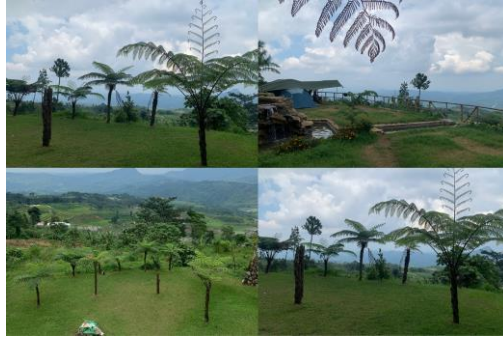
Gambar 1.2 Blok Camping Ground Lembah Pinus Camp & Cafe