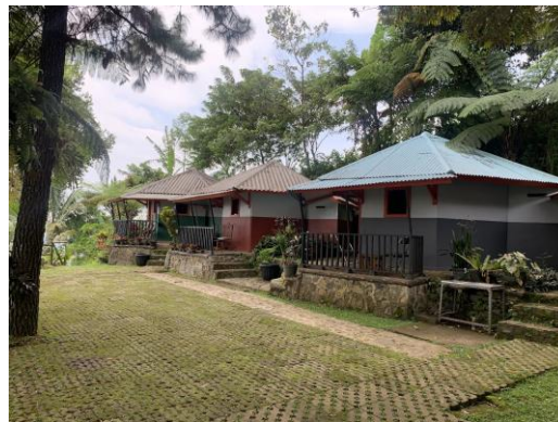
Gambar 1.3 Bungalow di Lembah Pinus Camp & Cafe

Selain itu, tersedia bungalow untuk pengunjung yang tidak ingin tidur di dalam tenda namun tetap ingin menikmati keindahan alam yang ditawarkan. Terdapat 3 bungalow yang bisa pengunjung sewa. Bungalow tersebut dibandrol dengan harga Rp 350.000 sampai Rp 400.000 per malamnya.