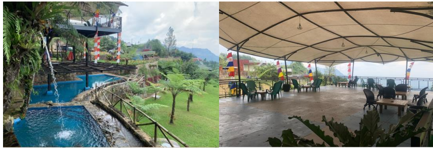
Gambar 1.4 Kolam Renang dan Cafe di Lembah Pinus Camp & Cafe

Lembah Pinus Camp & Cafe dilengkapi dengan kamar mandi yang bersih, musholla yang nyaman, parkir yang luas dan api unggun di area blok jambore. Para pengunjung yang ingin berkemah pun dapat menyewa alat-alat berkemah seperti tenda, kasur, bantal, selimut sampai alat untuk memanggang. Menurut pengelola, target pasar Lembah Pinus Camp & Cafe merupakan pengunjung dari setiap kalangan. Oleh karena itu, harga yang ditetapkan pun terbilang cukup murah dibandingkan pesaing-pesaingnya. Dibawah ini merupakan daftar harga untuk berkemah di Lembah Pinus Camp & Cafe.