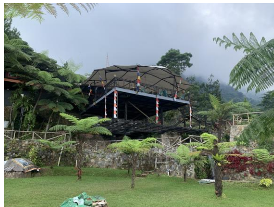
Gambar 1.1 Lembah Pinus

Lembah Pinus Camp & Cafe adalah salah satu destinasi wisata di Kabupaten Bogor, tepatnya di Kecamatan Sukamakmur. Lokasinya berada di dataran tinggi dengan luas 1 Ha dan berada di ketinggian 1.030 mdpl yang membuat suhu di daerah tersebut dingin dan sejuk. Awal mula Lembah Pinus Camp & Cafe ini merupakan villa pribadi milik Bapak Luthfie yang didirikan pada tahun 2019. Namun pada tahun 2020 saat pandemi COVID-19 merebak karena banyaknya permintaan konsumen yang ingin berlibur untuk mengatasi kejenuhan saat di rumah saja selama berbulan-bulan, oleh karena itu Lembah Pinus Camp & Cafe dibuka untuk umum dan dijadikan sebagai camping ground .