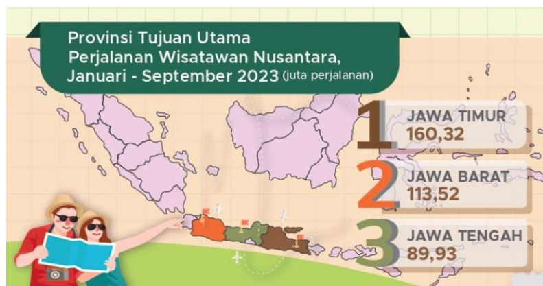
Gambar 1.6 Provinsi Tujuan Utama Perjalanan Wisatawan Nusantara

Kini sektor pariwisata Indonesia berangsur-angsur pulih, hal ini ditandai oleh meningkatnya tingkat kunjungan wisatawan mancanegara dan nusantara. Menurut Menteri Pariwisata dan Ekonomi Kreatif (Menparekraf) yaitu Sandiaga Uno, pada tahun 2023 tingkat kunjungan wisatawan mancanegara sampai bulan Oktober 2023 sebanyak 9,5 juta. Hal tersebut sudah jauh melewati dari target yang ditetapkan yaitu 8,5 juta wisatawan sampai akhir tahun 2023 (Indonesia.go.id, 2023). Menparekraf pun menambahkan bahwa tren tersebut ikut menaikkan pencapaian nilai devisa pariwisata Indonesia sampai US$ 6.08 miliar dengan kontribusi produk domestik bruto atau PDB sebesar 3.76% (Siswanto, 2023). Selain itu, berdasarkan berita resmi statistik mengenai perkembangan pariwisata dari bulan Januari sampai dengan September 2023 (triwulan III-2023), terdapat 192,52 juta perjalanan yang dilakukan oleh wisatawan nusantara dan jumlah ini meningkat sebesar 13.36% dibandingkan triwulan III-2022 ( year-on-year ) (Badan Pusat Statistik, 2023).