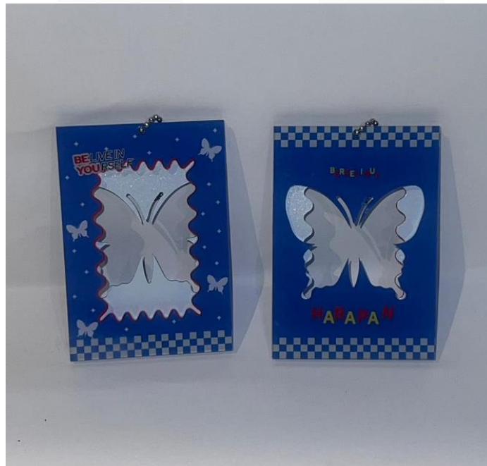
Gambar 8. Desain Card Holder

Card holder ini berfungsi untuk menyimpan kartu, ID, atau uang kecil. Dengan desain yang terkait dengan buku, card holder ini memberikan cara praktis dan stylish sebagai souvenir dalam buku.