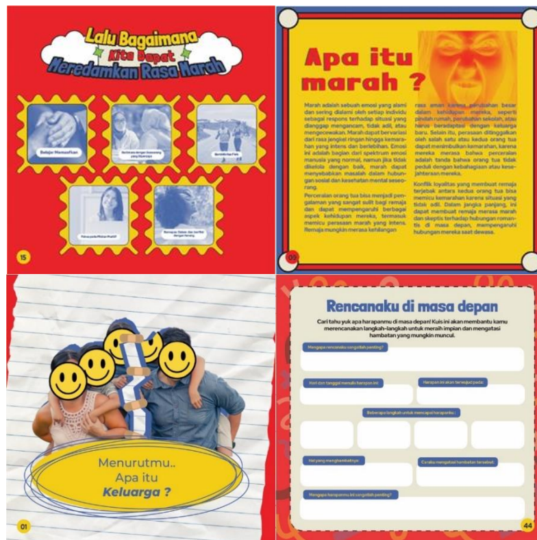
Gambar 5. Isi Buku