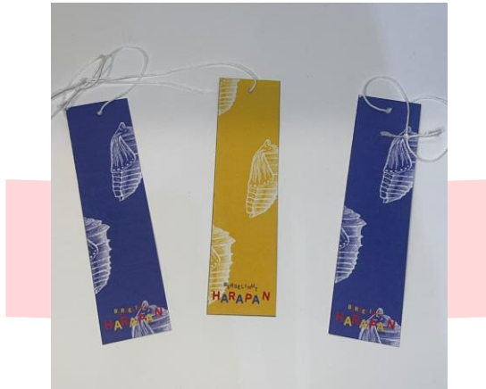
Gambar 9. Pembatas Buku

Pembatas buku ini membantu pembaca menandai halaman yang sedang mereka baca. Selain itu, bentuknya yang praktis dan terdapat tali di atasnya memudahkan pembaca menemukan halaman mereka.