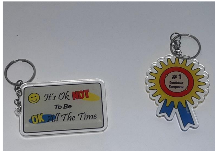
Gambar 7. Desain Gantungan Kunci