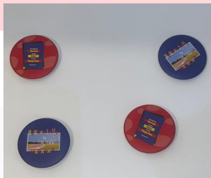
Gambar 6. Desain Pin

Pin dapat digunakan sebagai aksesoris yang dapat digunakan pada tas dan pakaian. Pin ini juga dapat digunakan sebagai souvenir atau bentuk dukungan mereka.