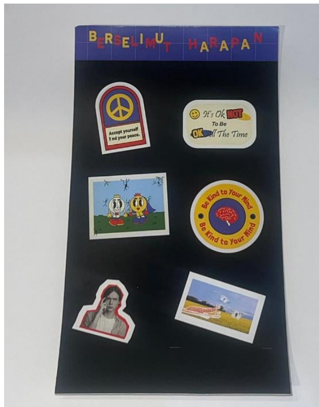
Gambar 8. Desain Stiker