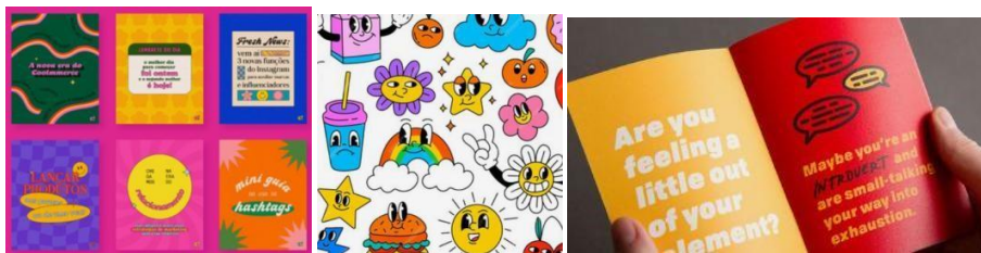
Gambar 1. Moodboard