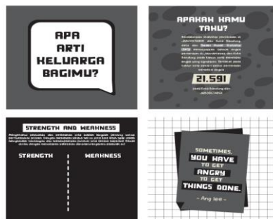
Gambar 3. Sketsa Buku Interaktif